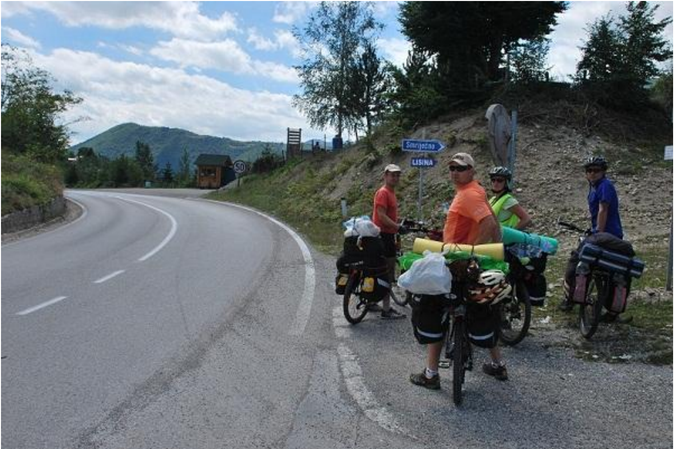
Фото 15. Перевал а/м Straznica (1046м).