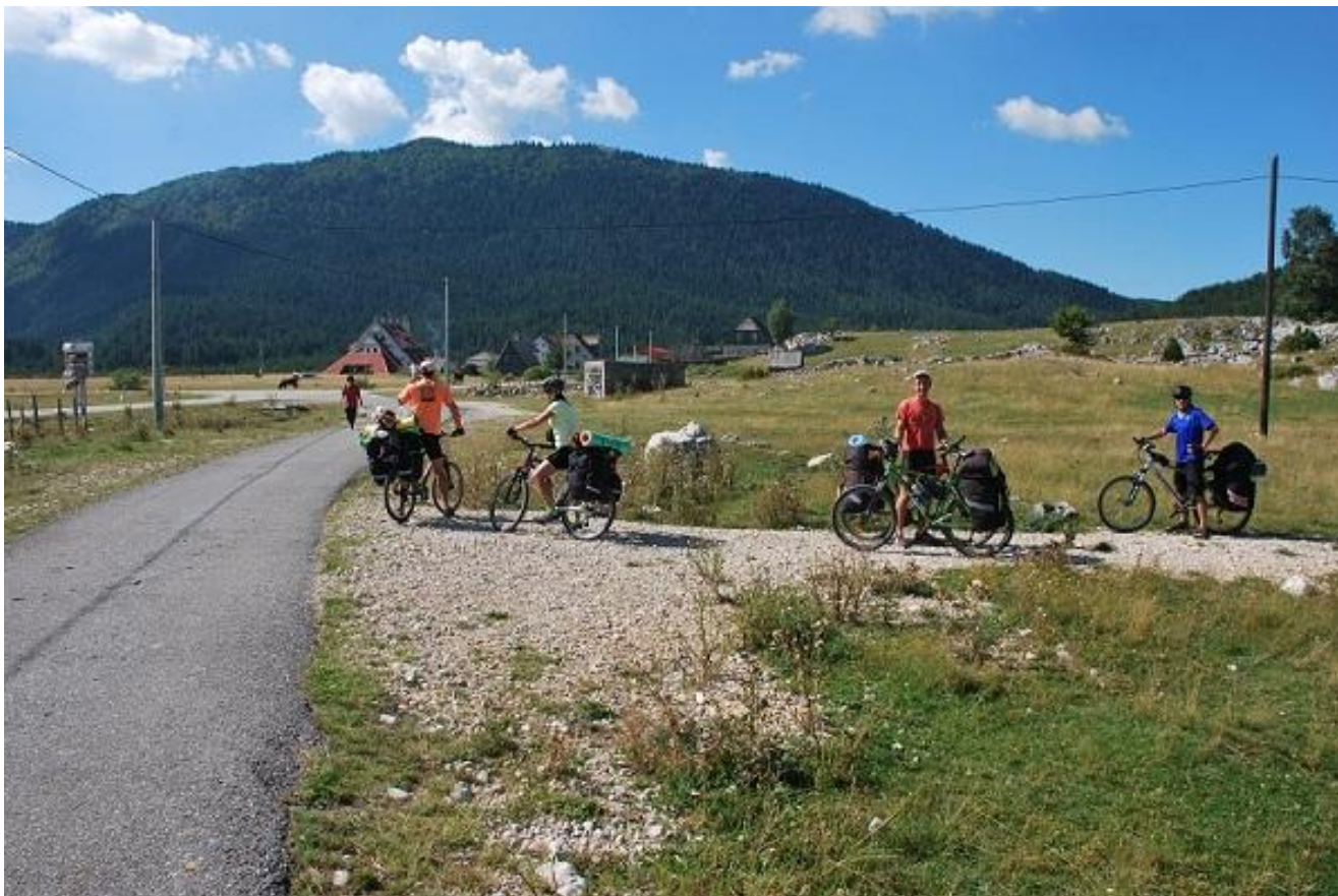
Фото 63. Конец грунтовой дороги. Выезд к п. Njegovuda.