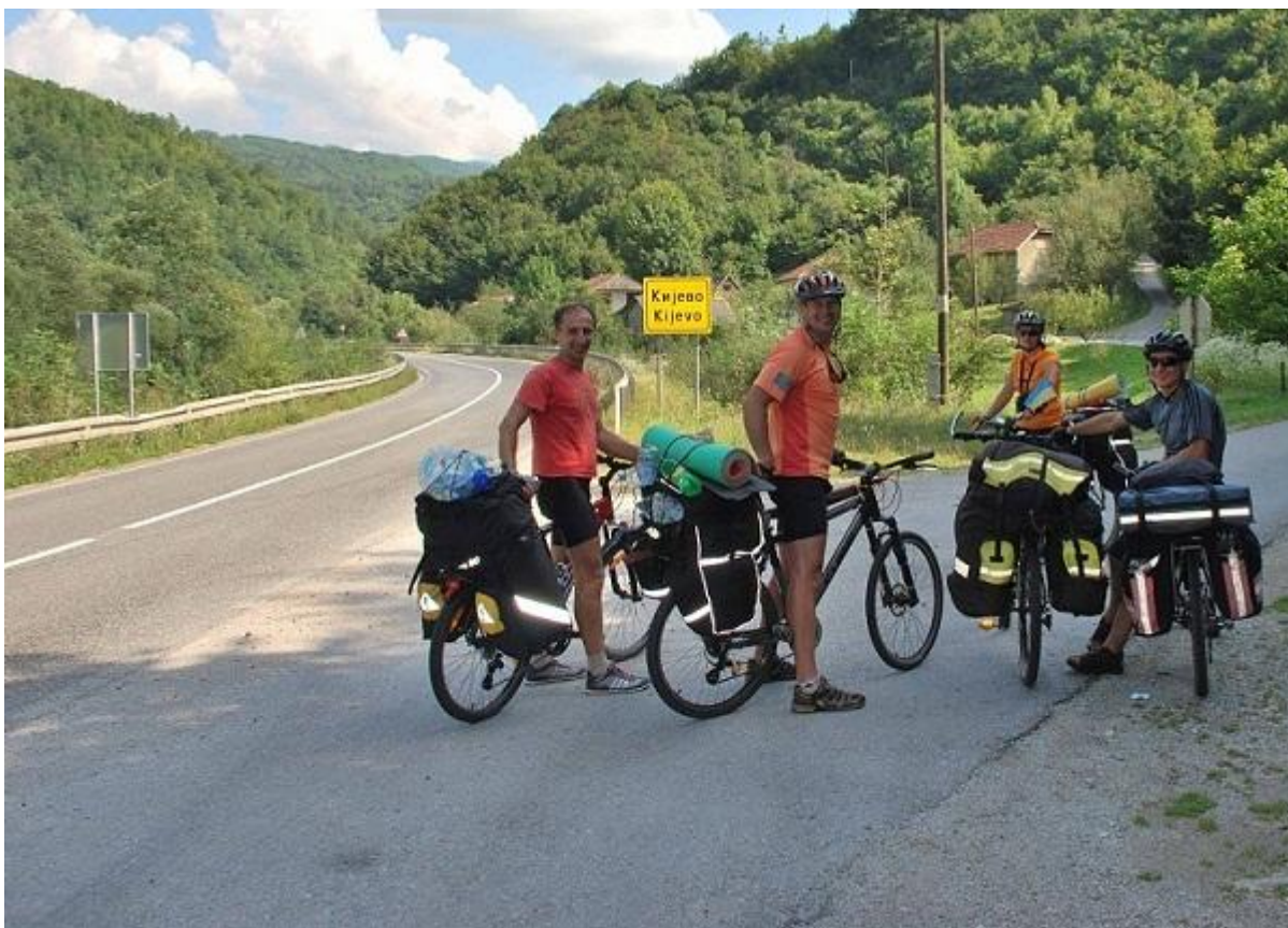
Фото 2. Kijevo.