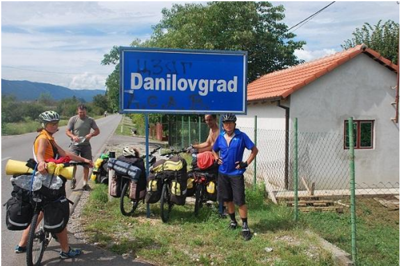
Фото 89. Danilovgrad.