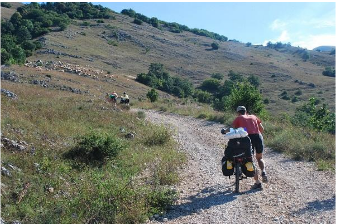
Фото 24. Начало грунтовой дороги на перевал Dragalievo.