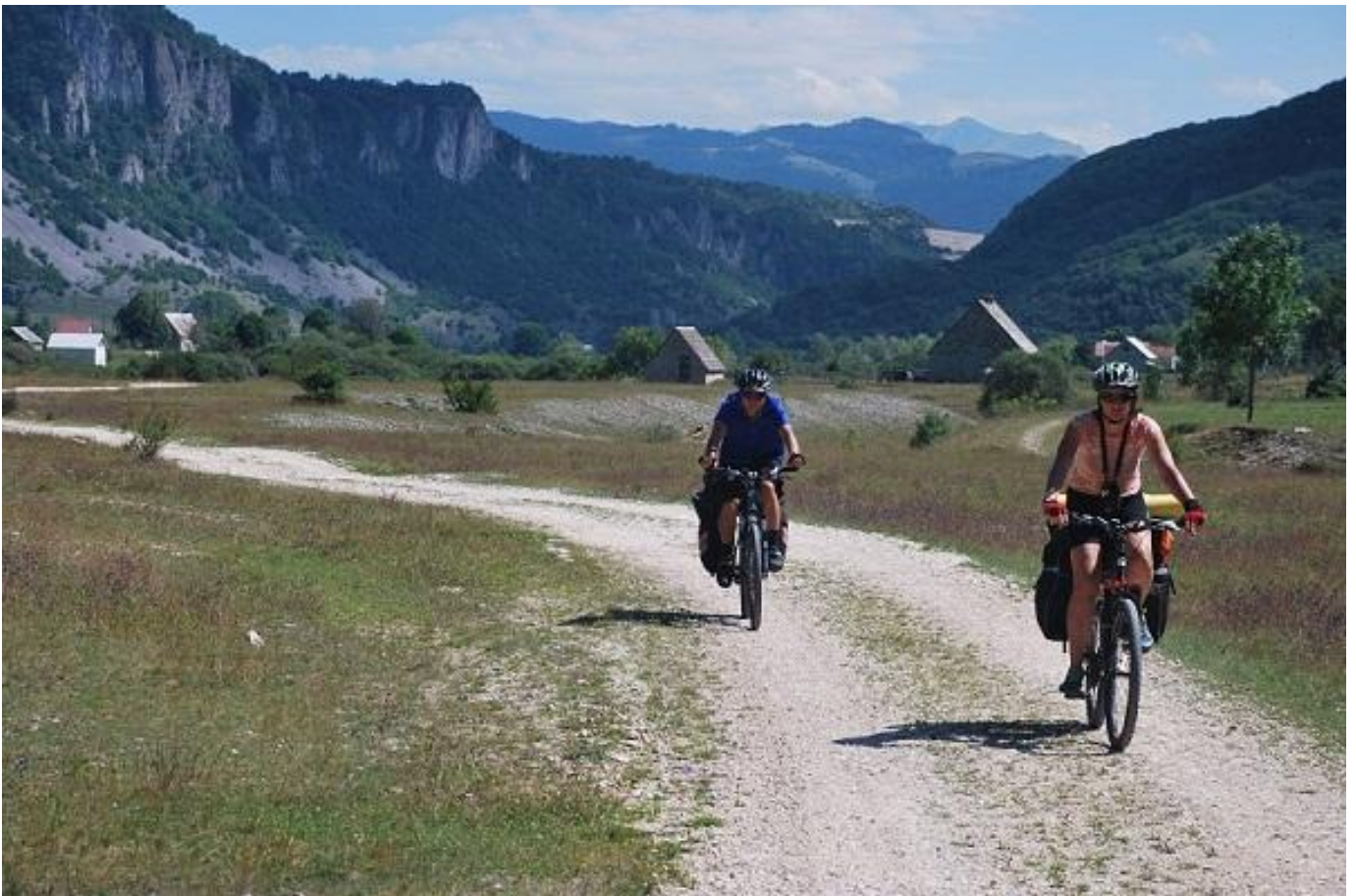
Фото 30. Участок дороги при выезде из п. Комарница.