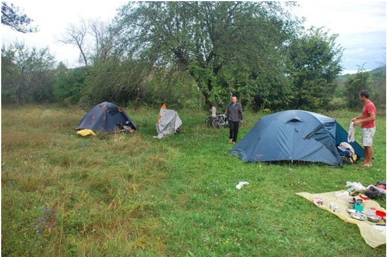
Фото 92. Остановка на ночлег в заброшенном саду возле закрытой школы Сево.