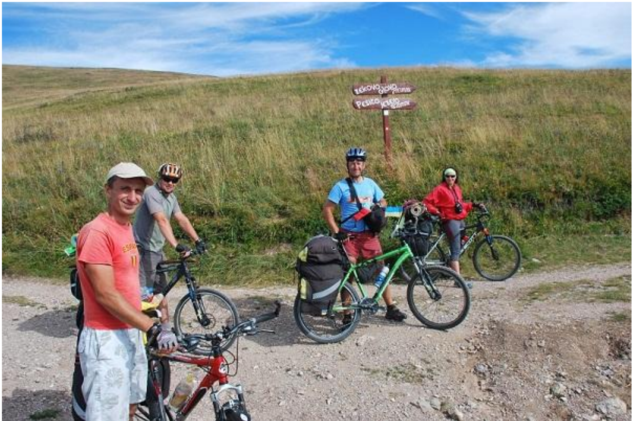
Фото 75. Перевал Биоградска гора (1932м). Указатељ на прављењих вершин.