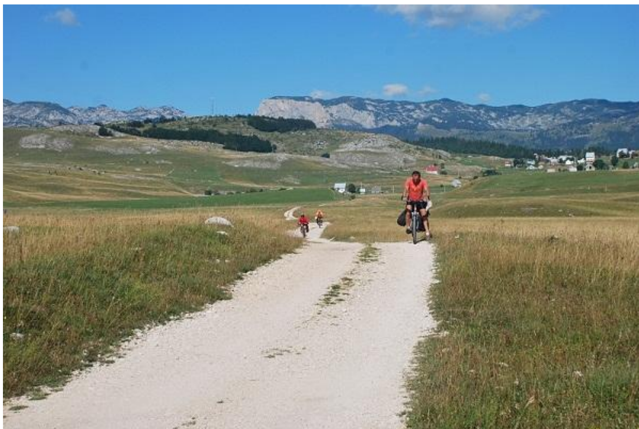
Фото 61. Участок дороги грунтовой дороги Zabljuk – пер. Zabljuk.