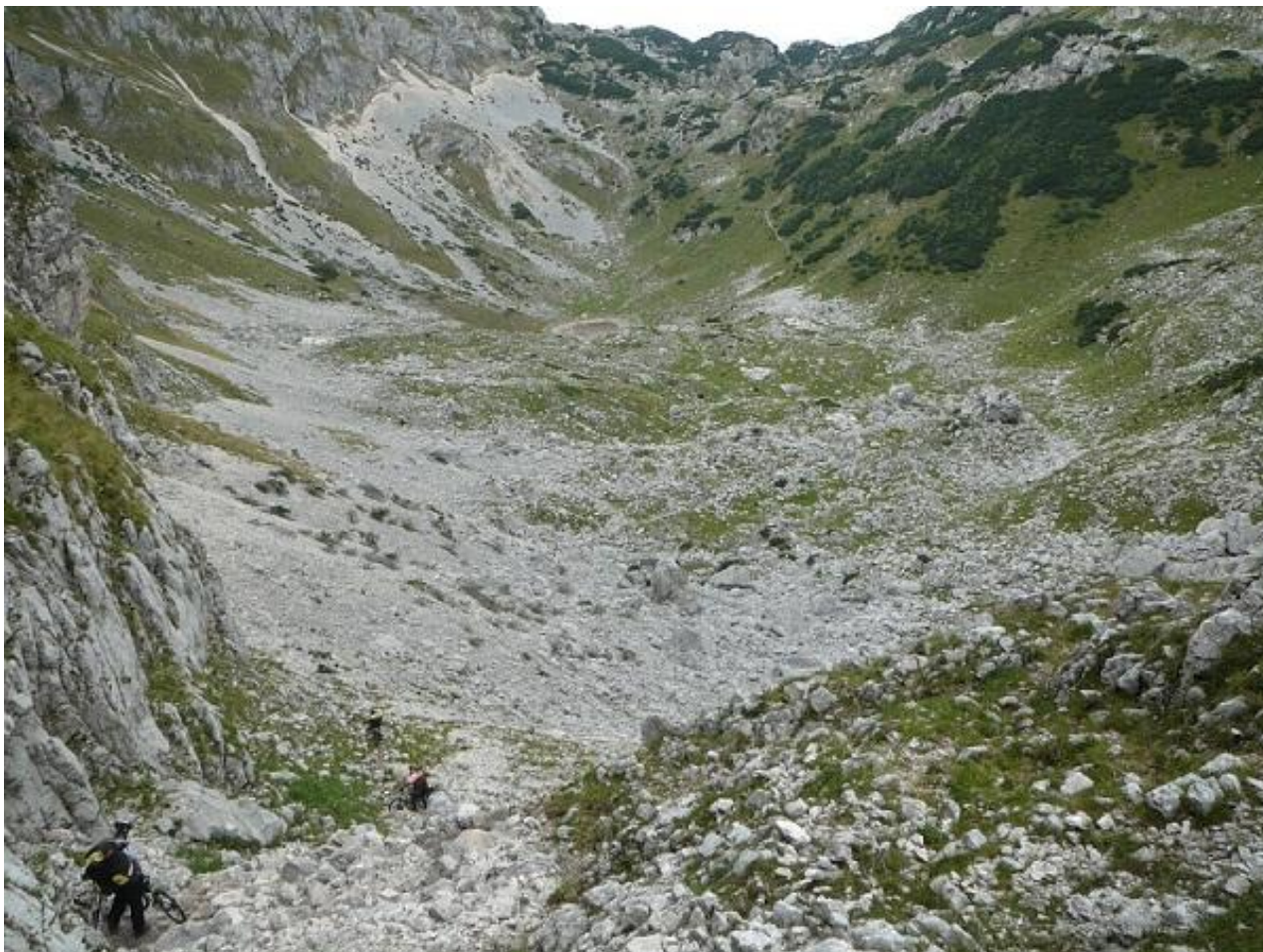
Фото 51. Участок спуска с перевала Тројној. Вид на пересохшее озеро Lokvice.