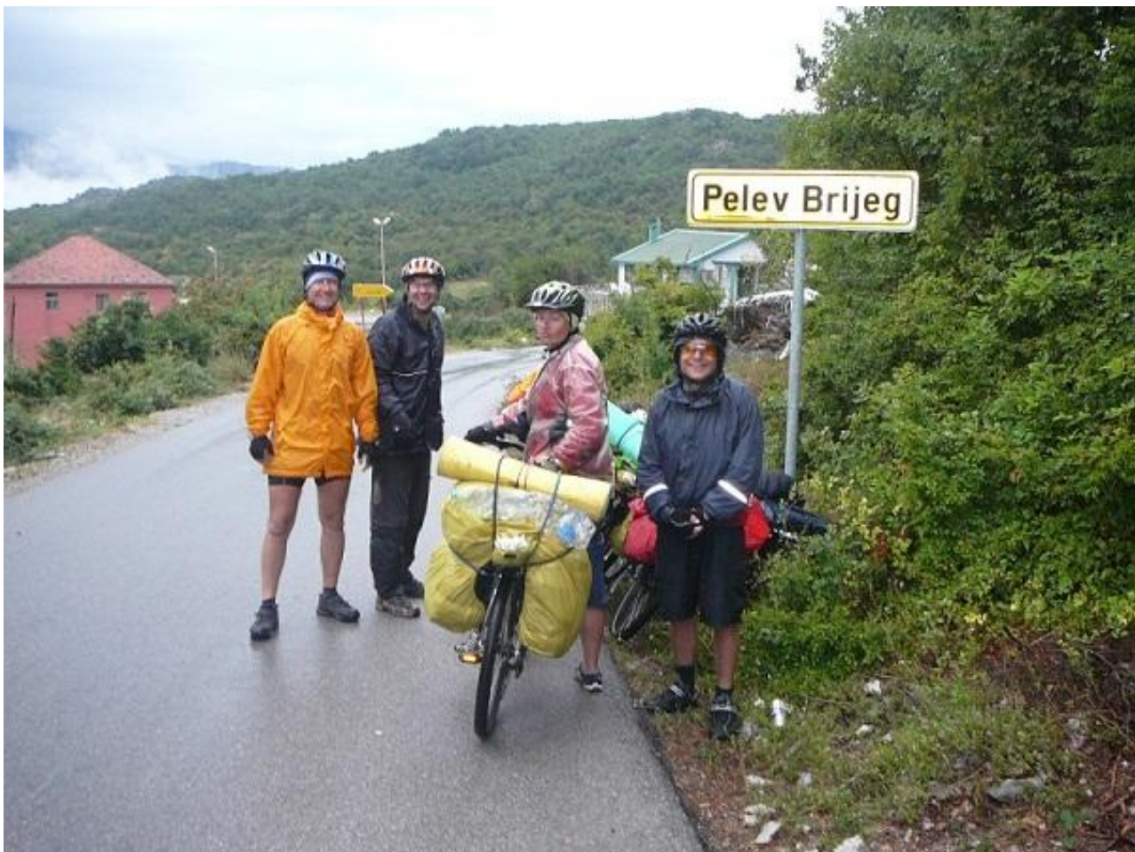
Фото 86. Pelev Brijeg.