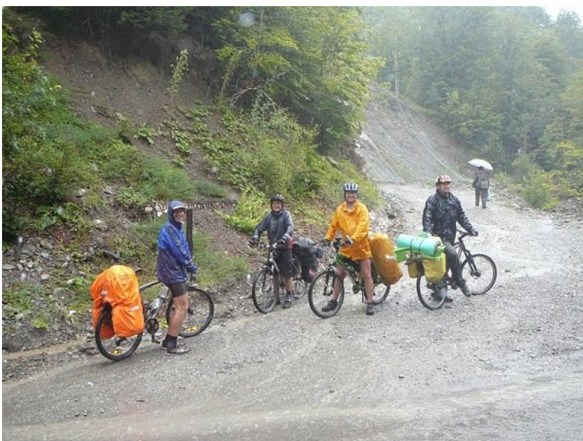
Фото 82. Выезд на асфальтированную дорогу к Matesevo.