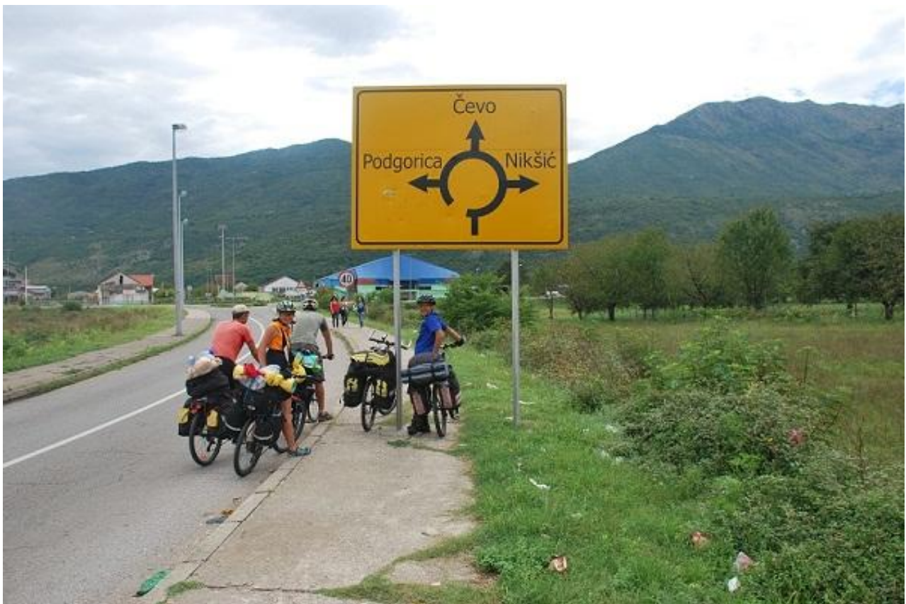
Фото 90. Кольцевая развязка дорог. Указатель на выезде из Danilovgrad.