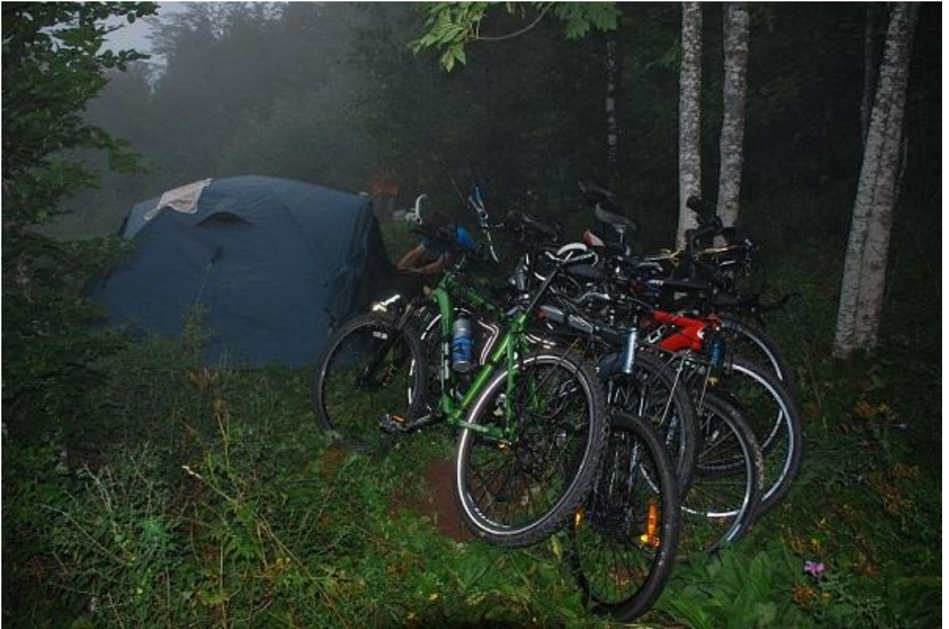
Фото 5. Место ночевки в лесу на перевале.