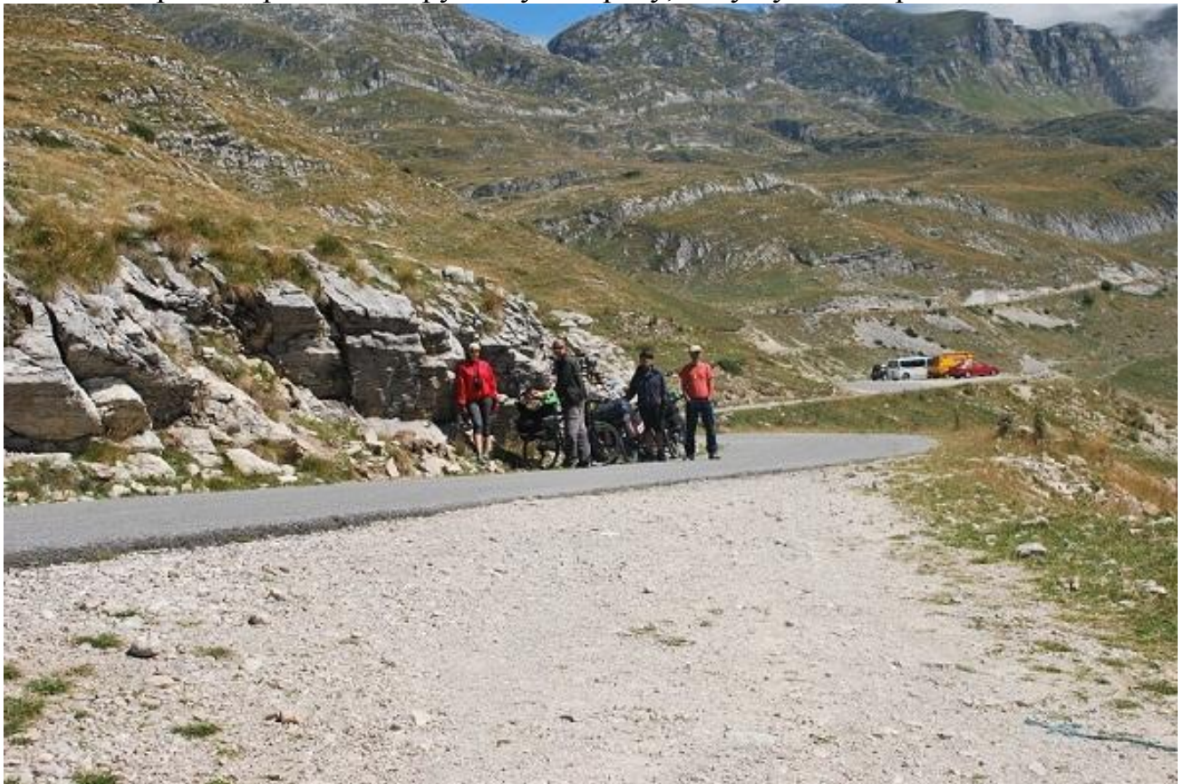
Фото 42. Выход на асфальтированную дорогу перед перевалом Sedlo.