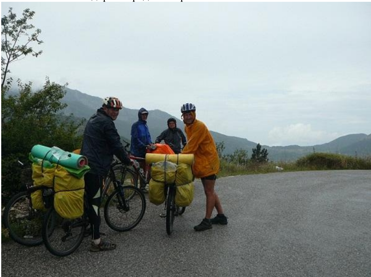
Фото 94. Перевал а/м (1119м).