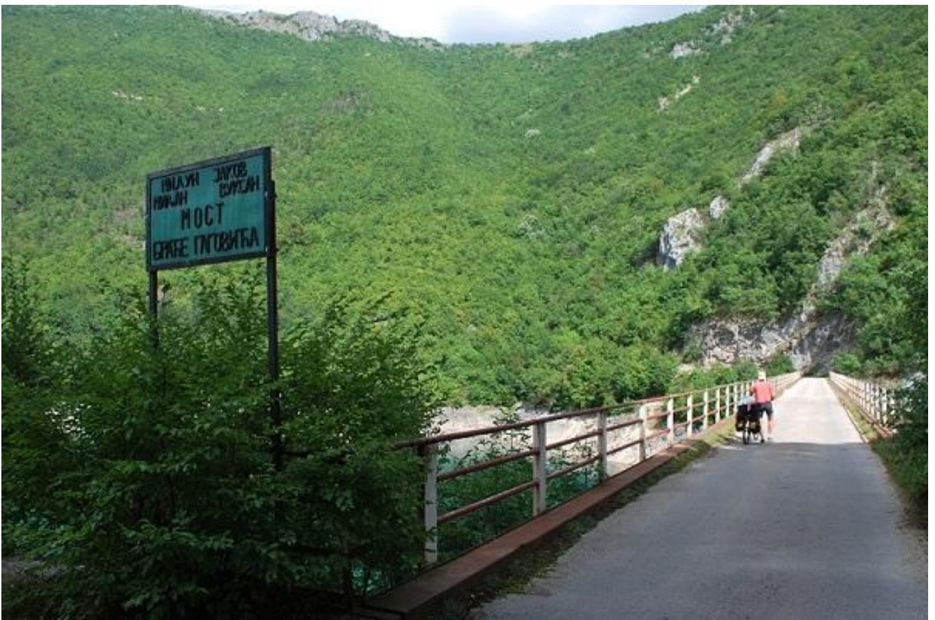
Фото 20. Мост браћев Гаговича через пивско водохранилище (680м).