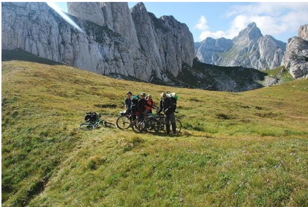
Фото 49. Перевал Тгојној (2245м).