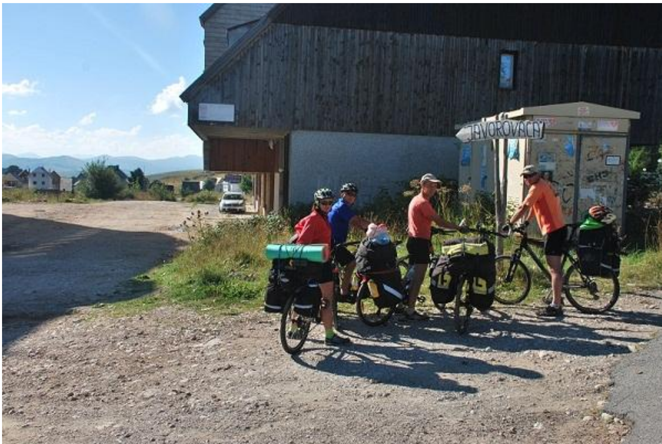
Фото 60. Выезд из Zabljuk. Указатель поворота на Javorovaca, выезд на грунтовую дорогу.