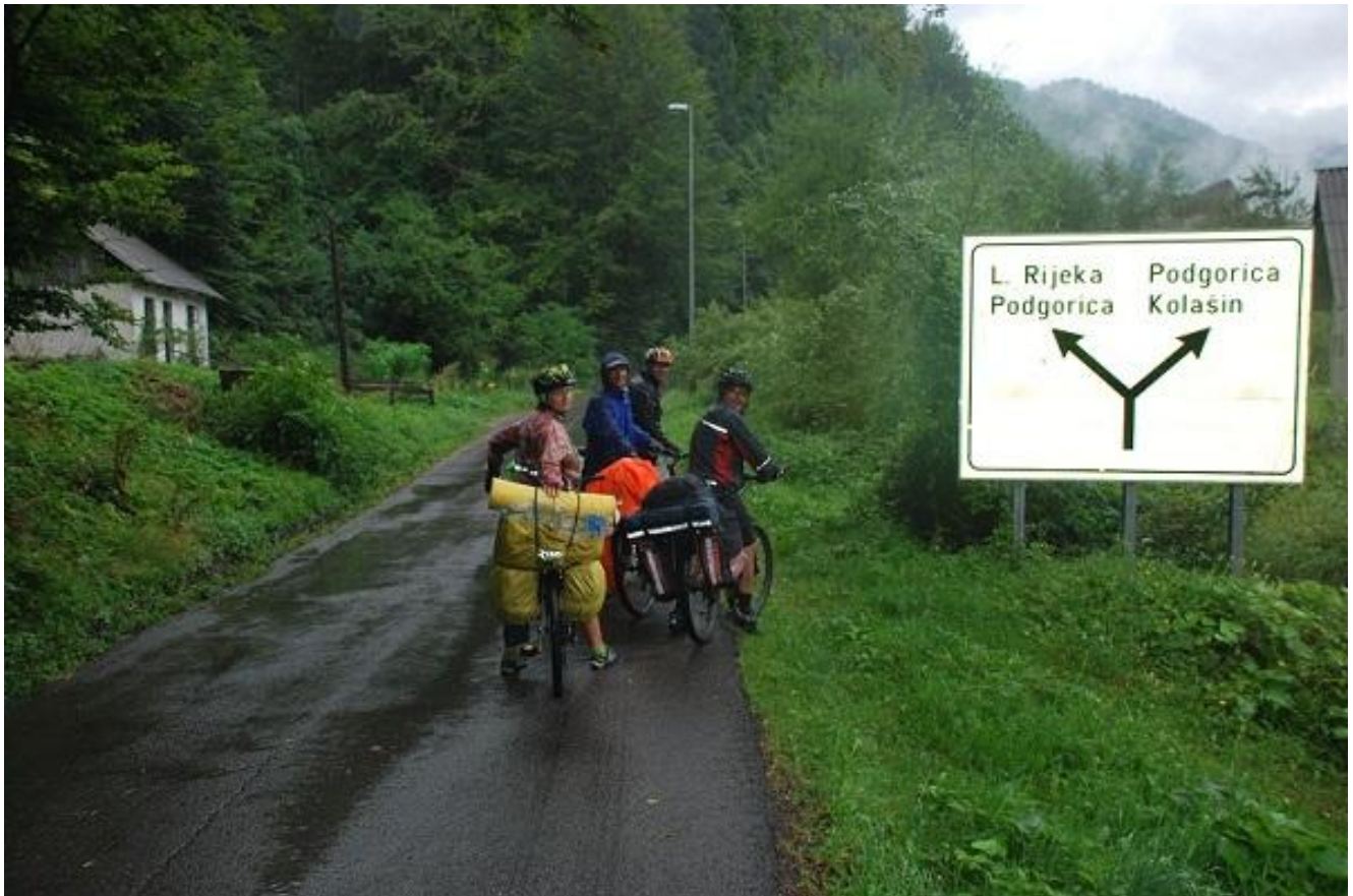
Фото 83. Развилка направлений.