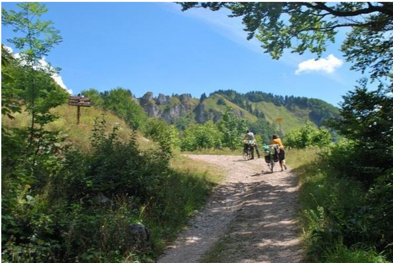
Фото 71. Участок дороги подъема на перевал Виоградска гора.