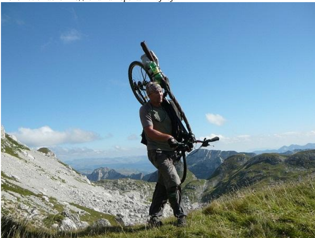
Фото 48. Трудный участок подъема на перевал Тројној.