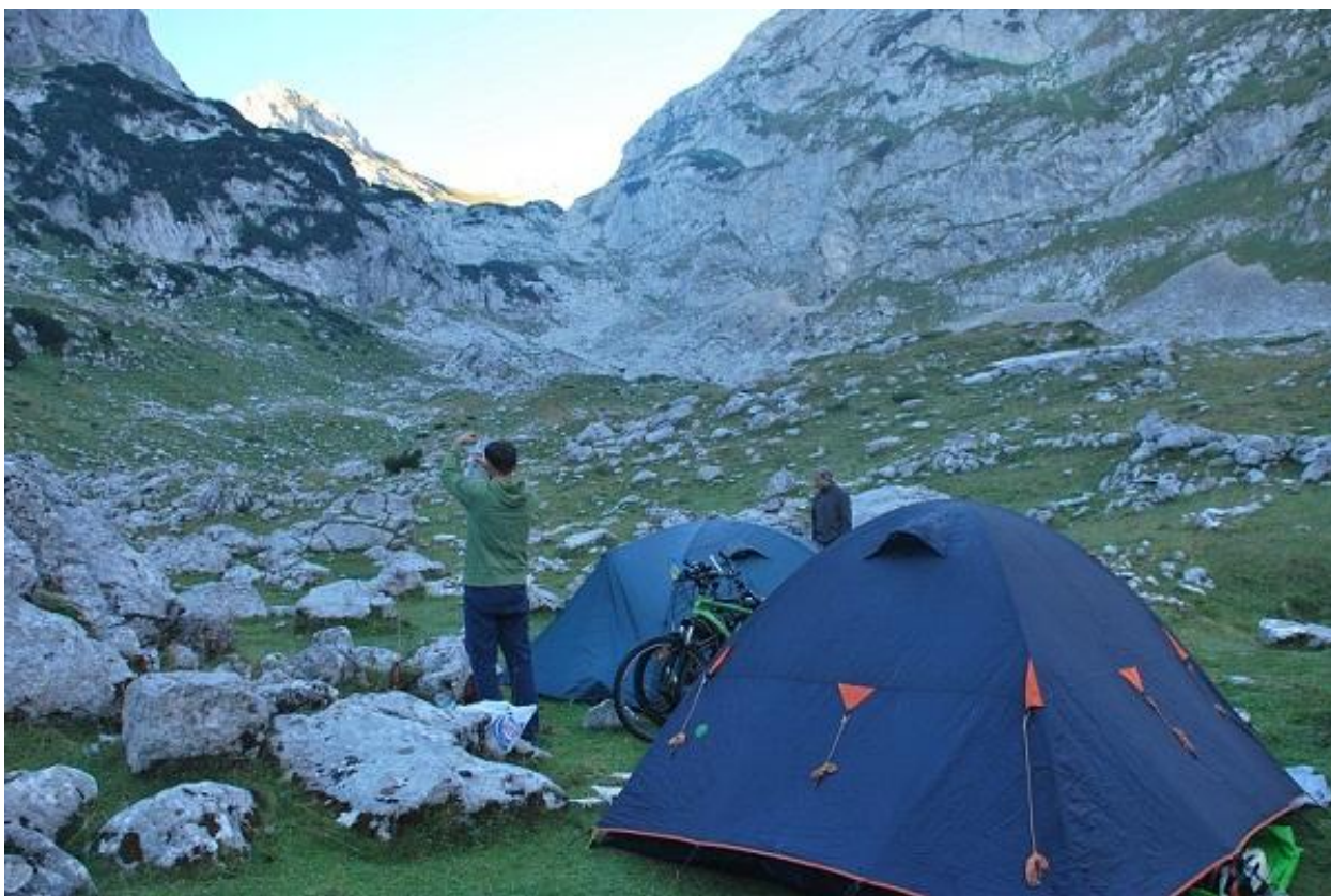
Фото 52. Остановка на ночлег. Вид на перевал Тројној.