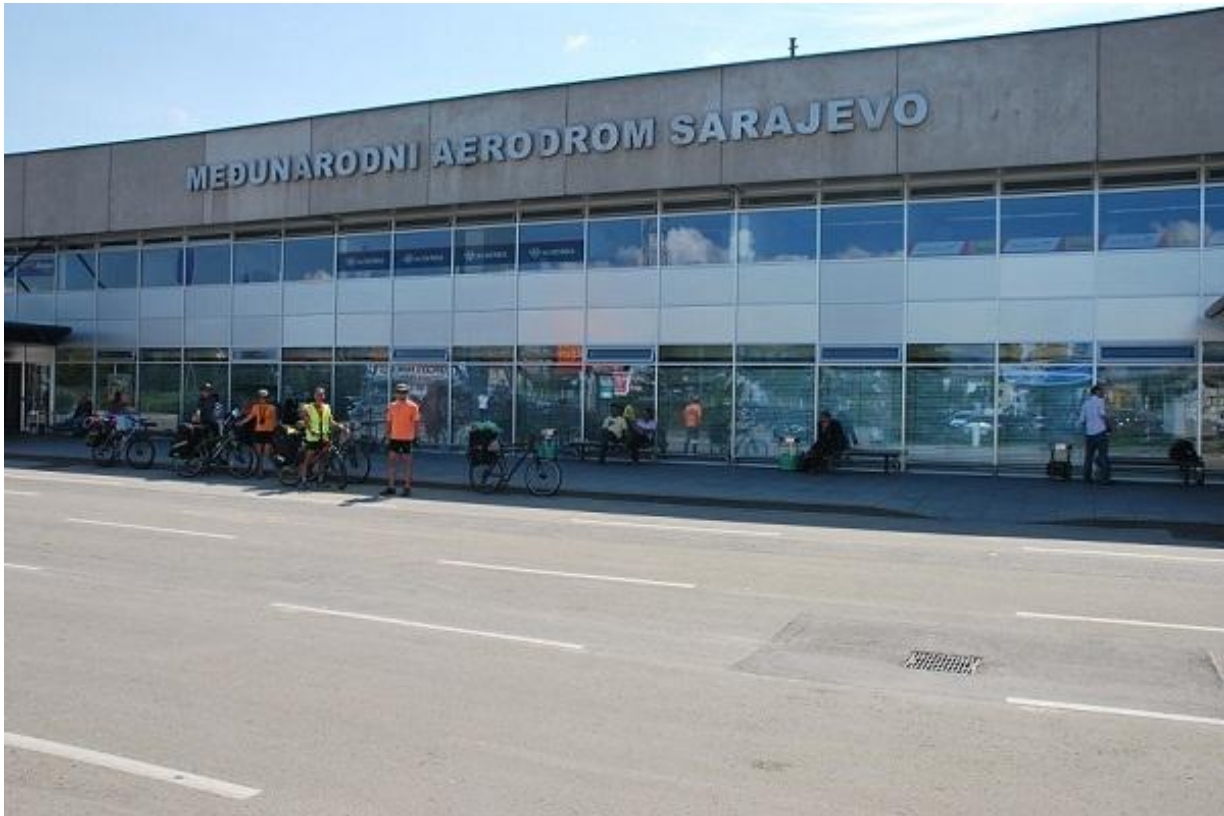
Фото 1. Аэропорт Sarajevo.