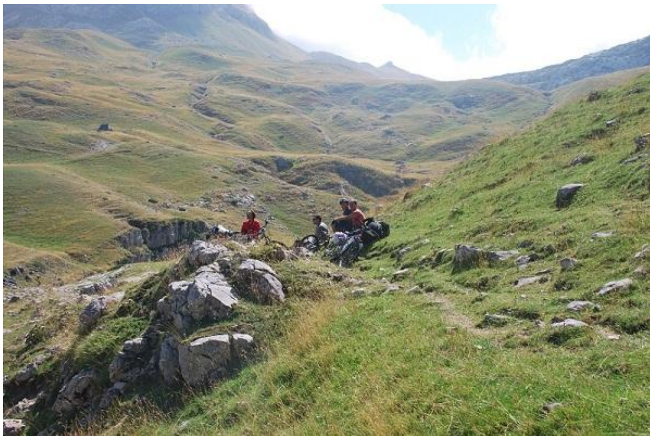
Фото 39. Выход тропы из каньона р. Комарница.