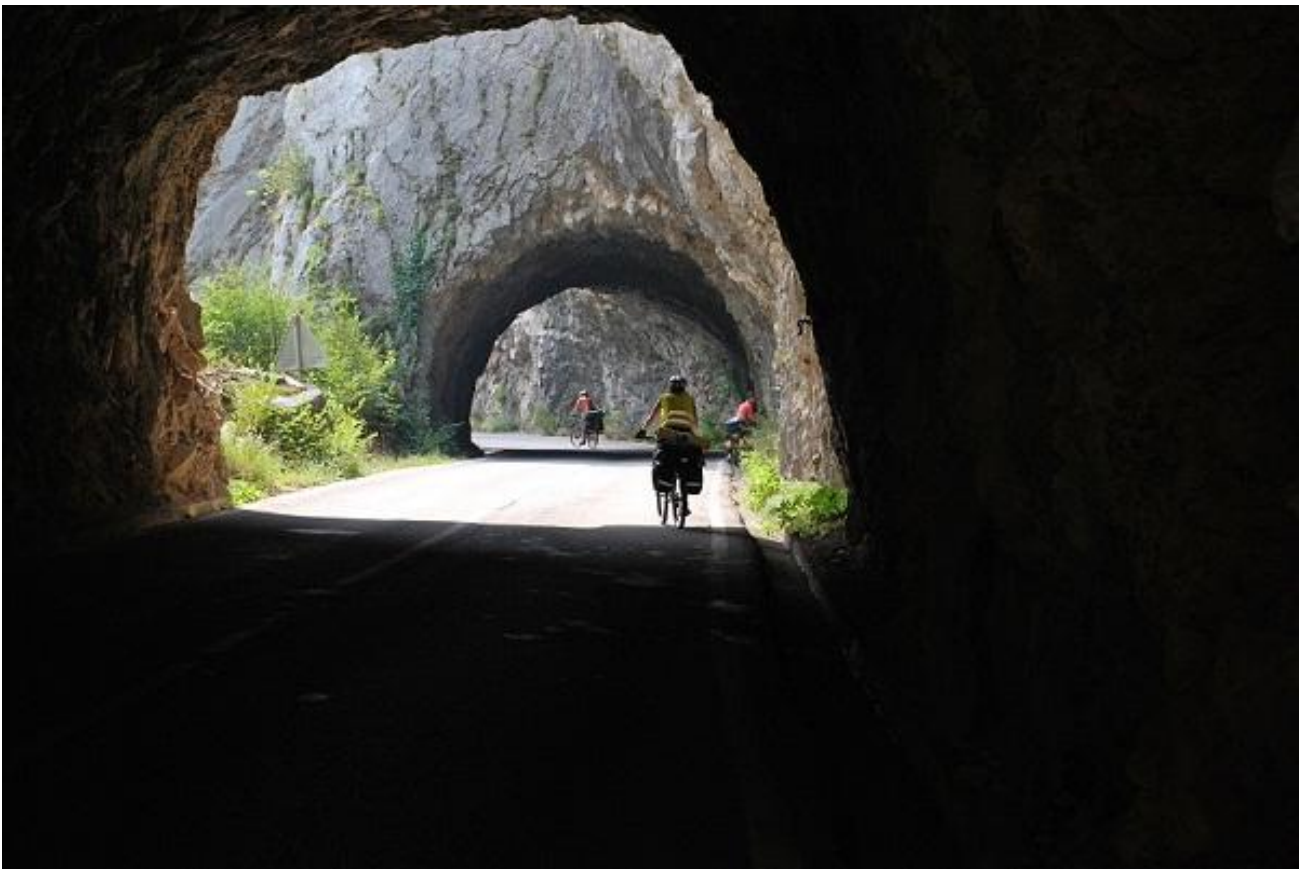
Фото 10. Тоннели. Участок дороги вдоль каньона р. Рива.