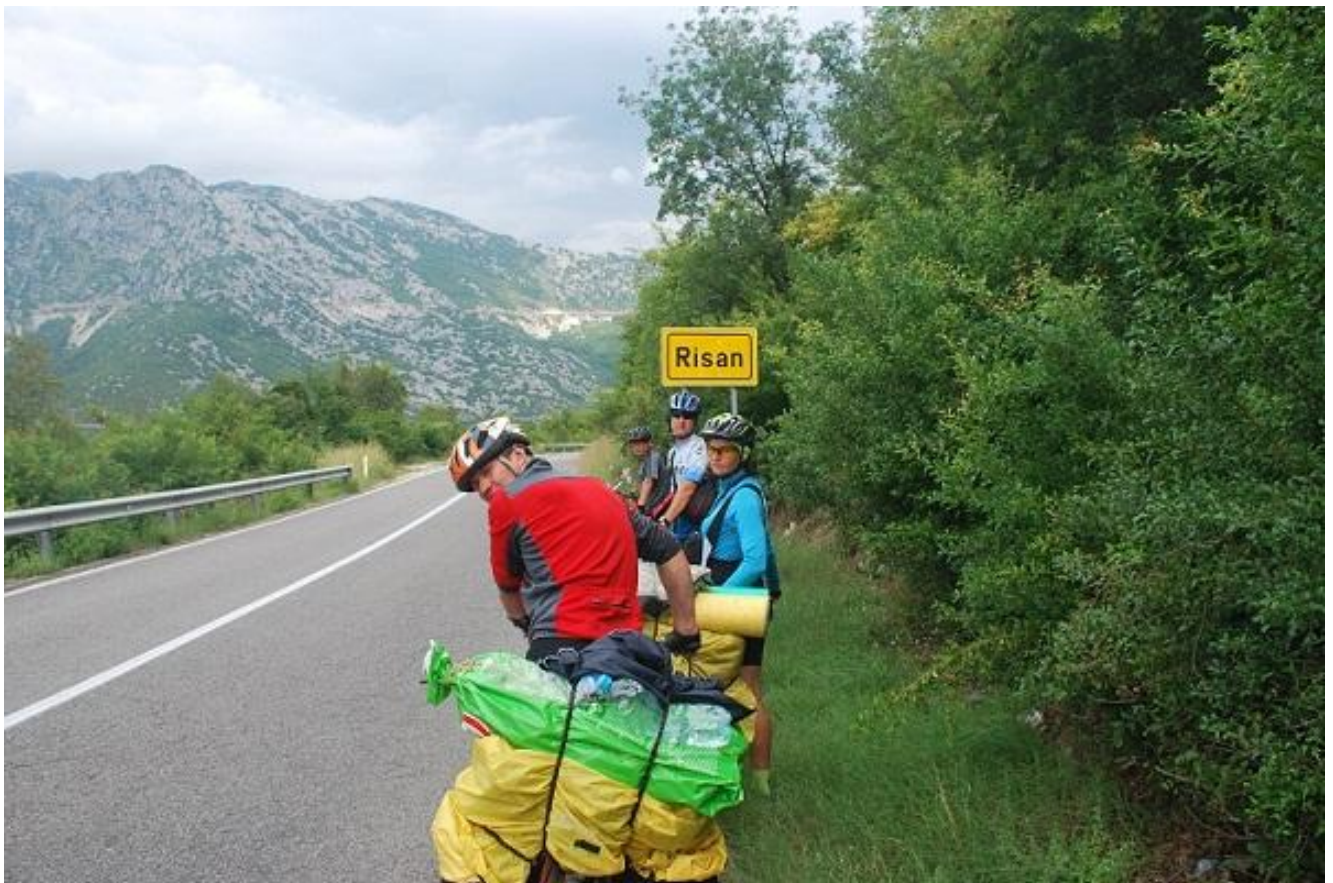
Φοτο 98. Risan.