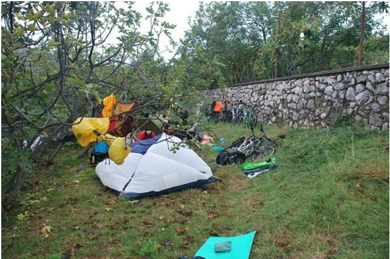
Фото 85. Остановка на ночлег за Матесево.