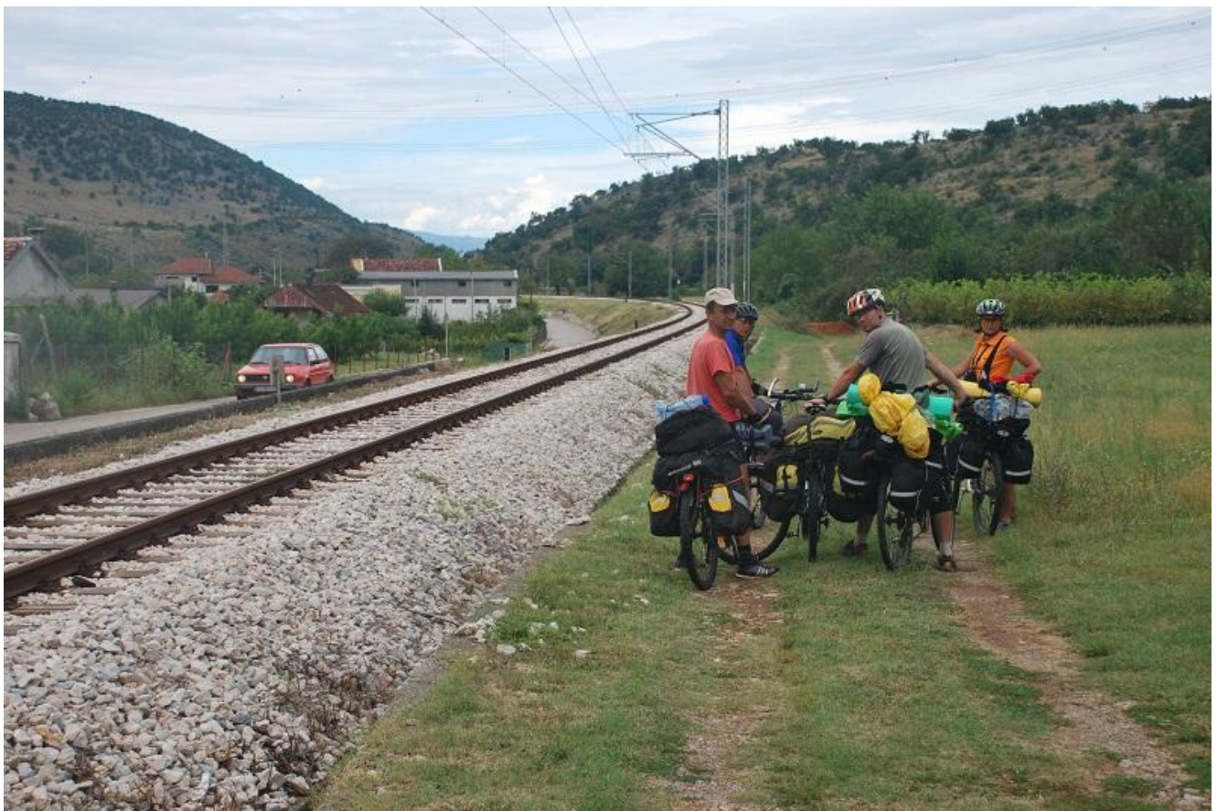
Фото 88. Начало грунта вдоль ж/д путей в Danilovgrad.