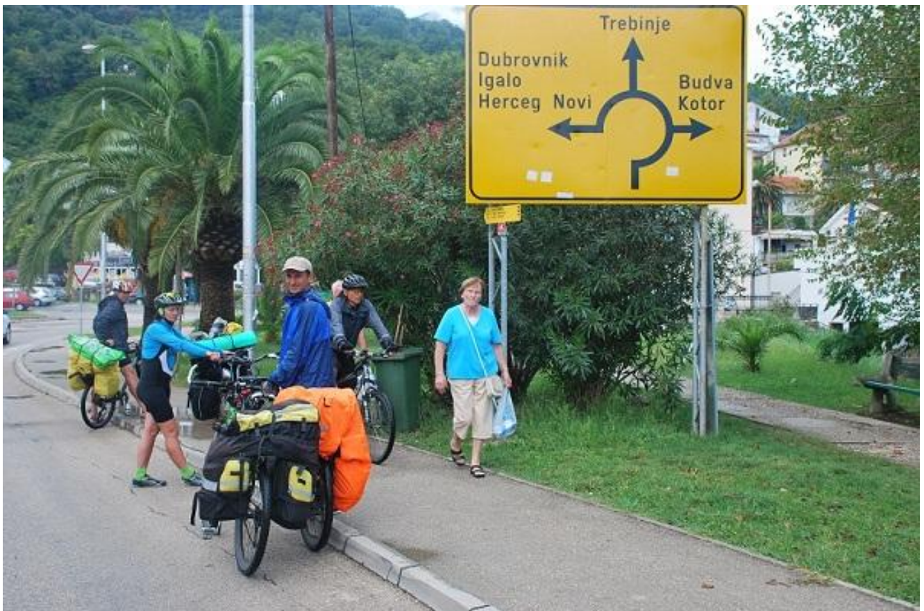
Фото 100. Герцег Нови. Указатель на кольце дорог при выезде из города.