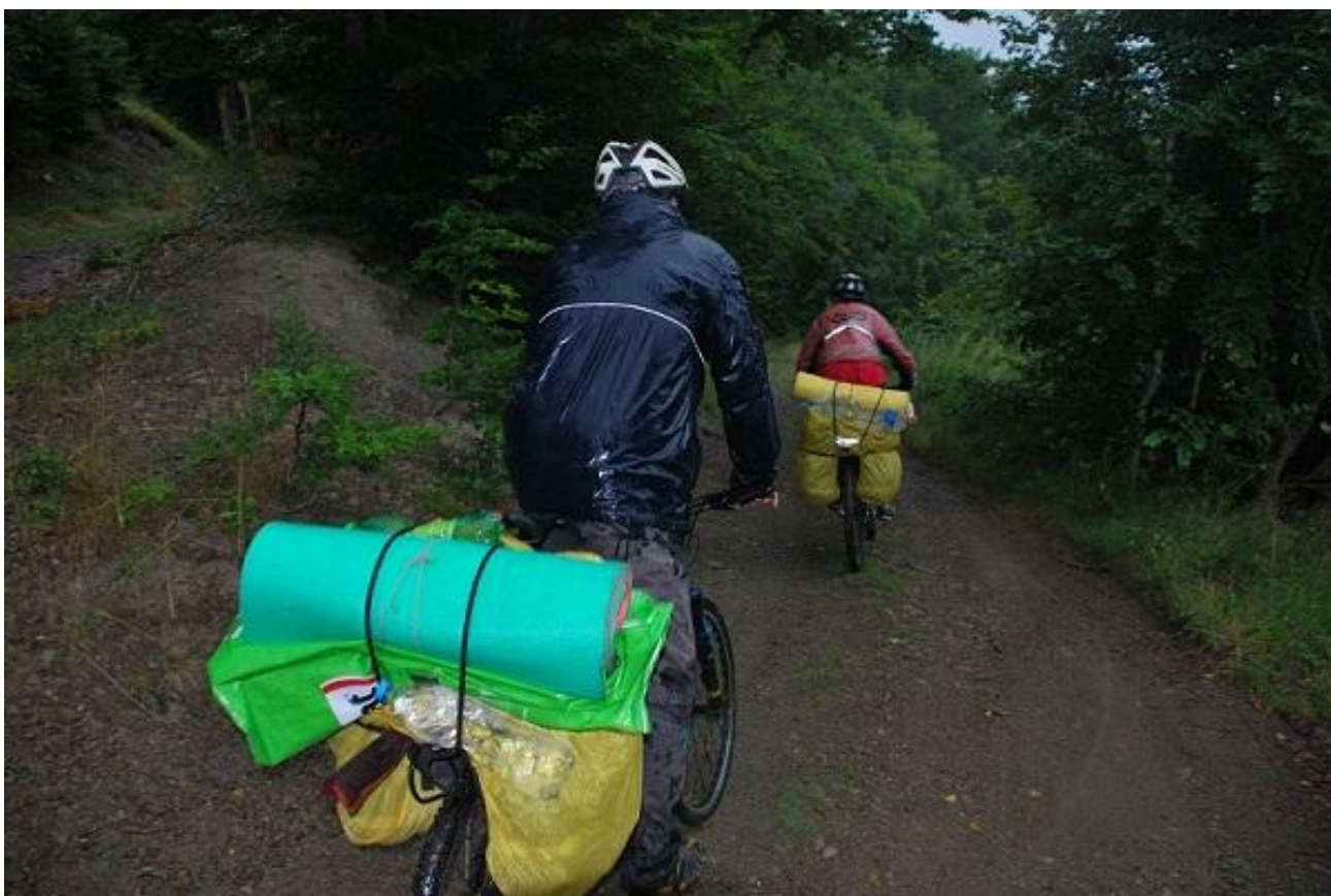
Фото 80. Участок лесной дороги на спуске в Krivi Do.