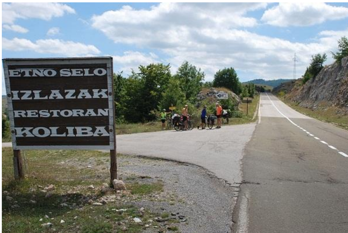
Фото 18. Etno Selo. Поворот к Izlazak.