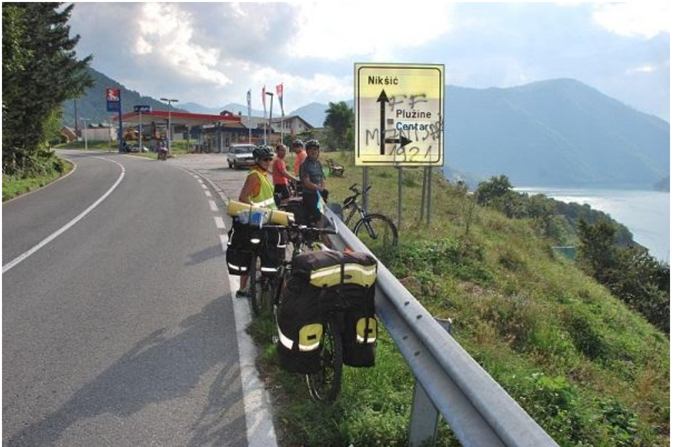
Фото 13. Pluzine.