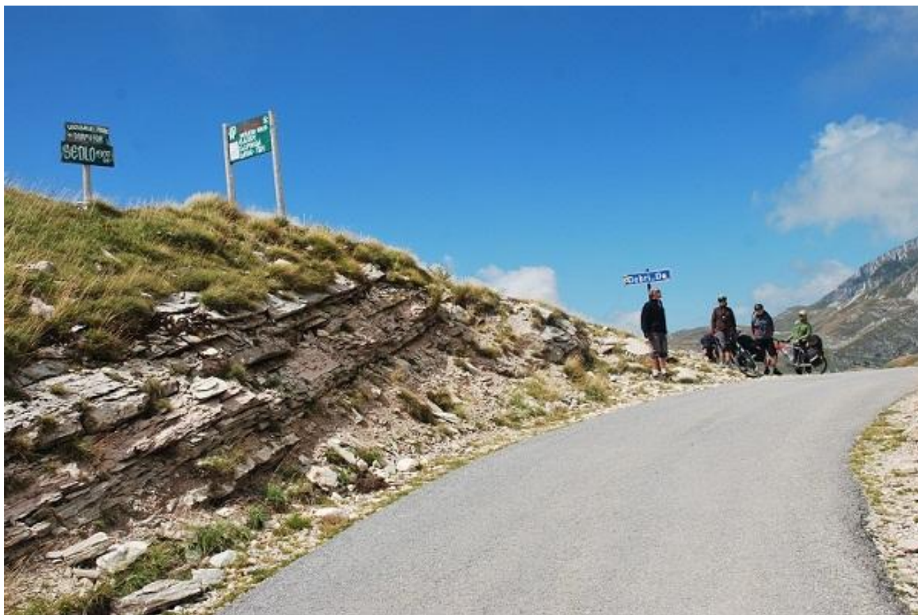
Фото 43. Перевал Sedlo (1907м).