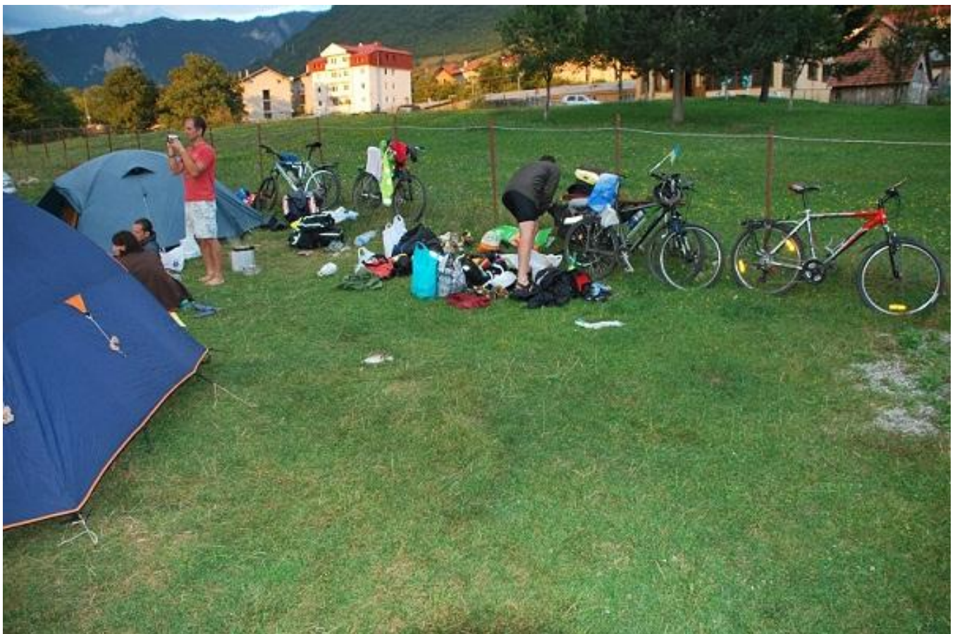
Фото 14. Место ночевки на берегу водохранилища в Pluzine.