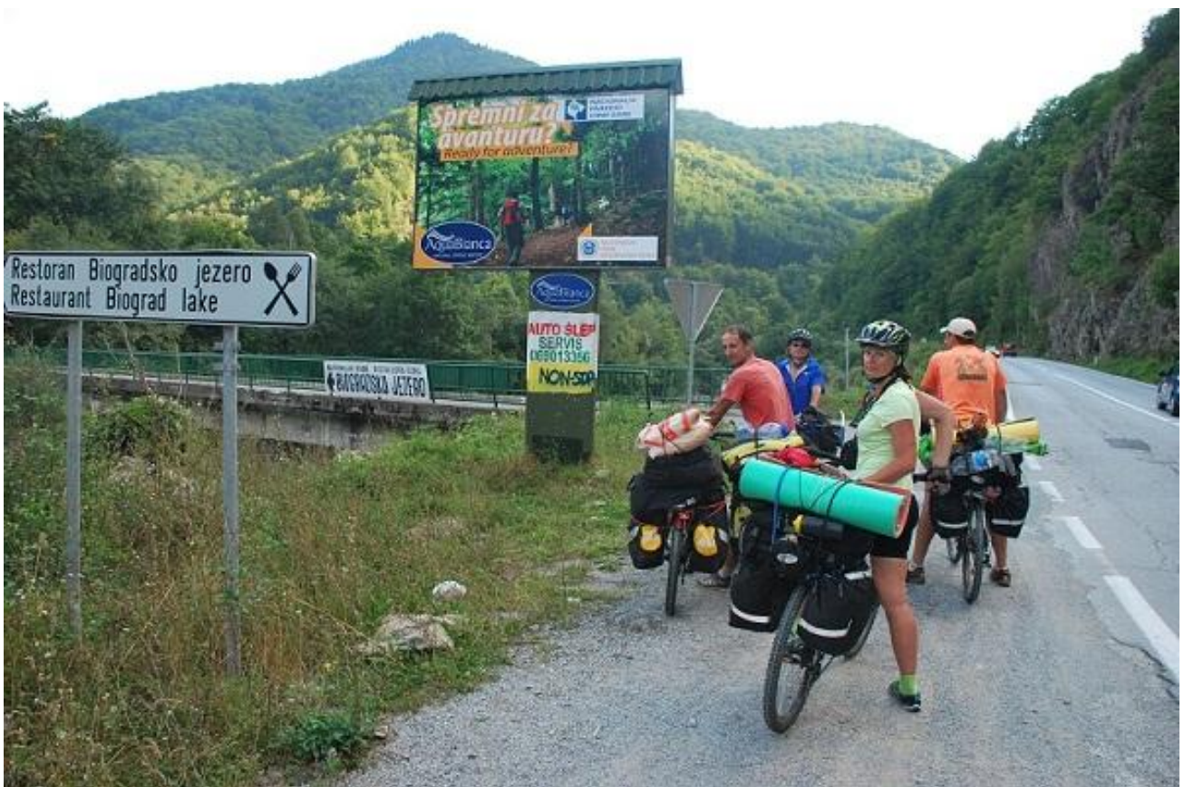
Фото 68. Указатељ поворота к Biogradsko jezero.