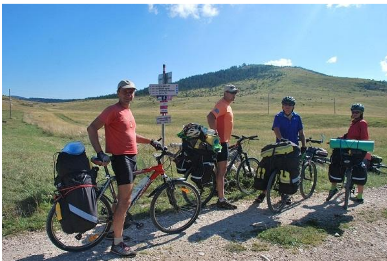
Фото 62. Развилка грунтовых дорог. Указатель туристических маршрутов по дороге к пер. Zabljuk.