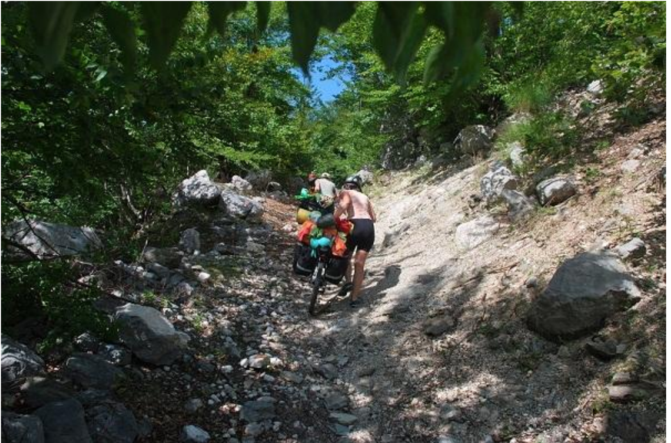
Фото 31. Начало лесной каменистой тропы вверх по распадку р. Котарница.