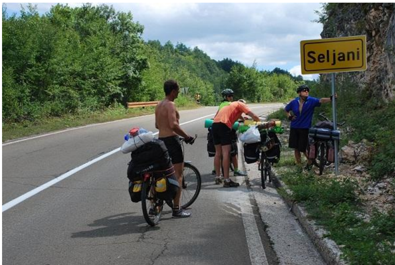
Фото 17. Seljani.