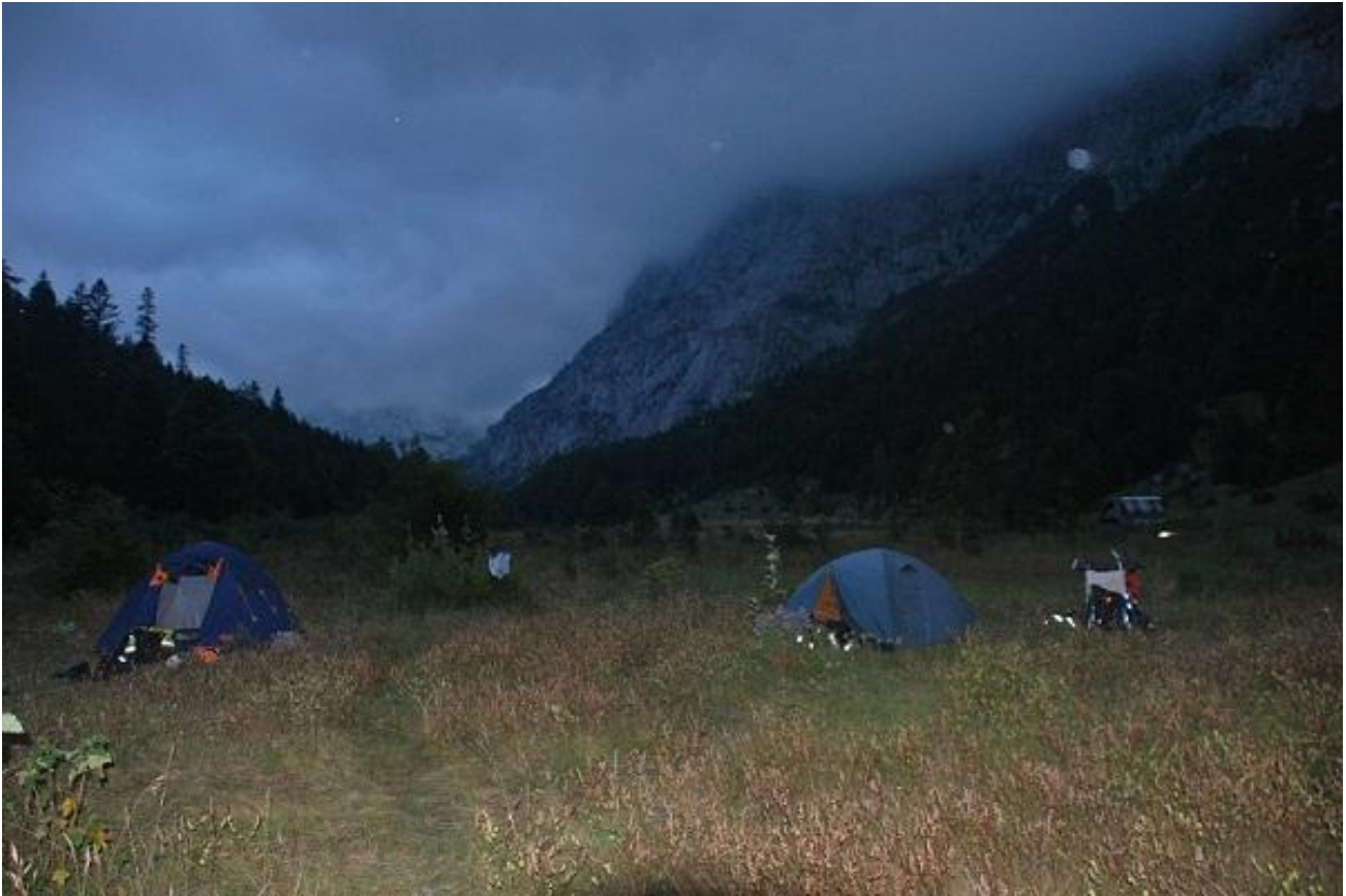
Фото 35. Остановка на ночлег в долине каньона р. Комарница.