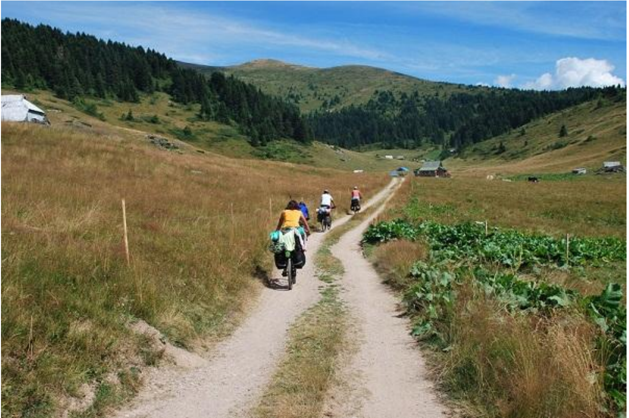
Фото 73. Участок грунтовой дороги к перевалу Биградска гора.