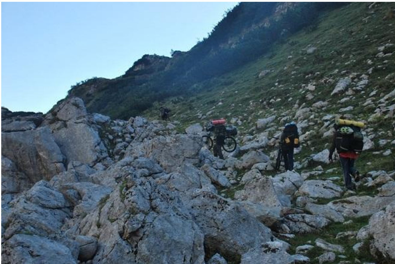
Фото 53. Участок каменистой тропы Lokvice – Ivan Do.