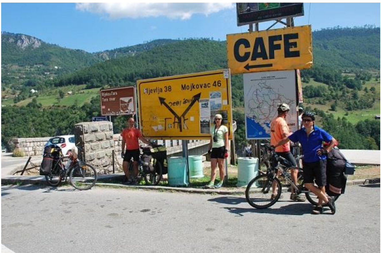
Фото 66. Мост Джурджевича через каньон р. Тара. Указатель дорог.