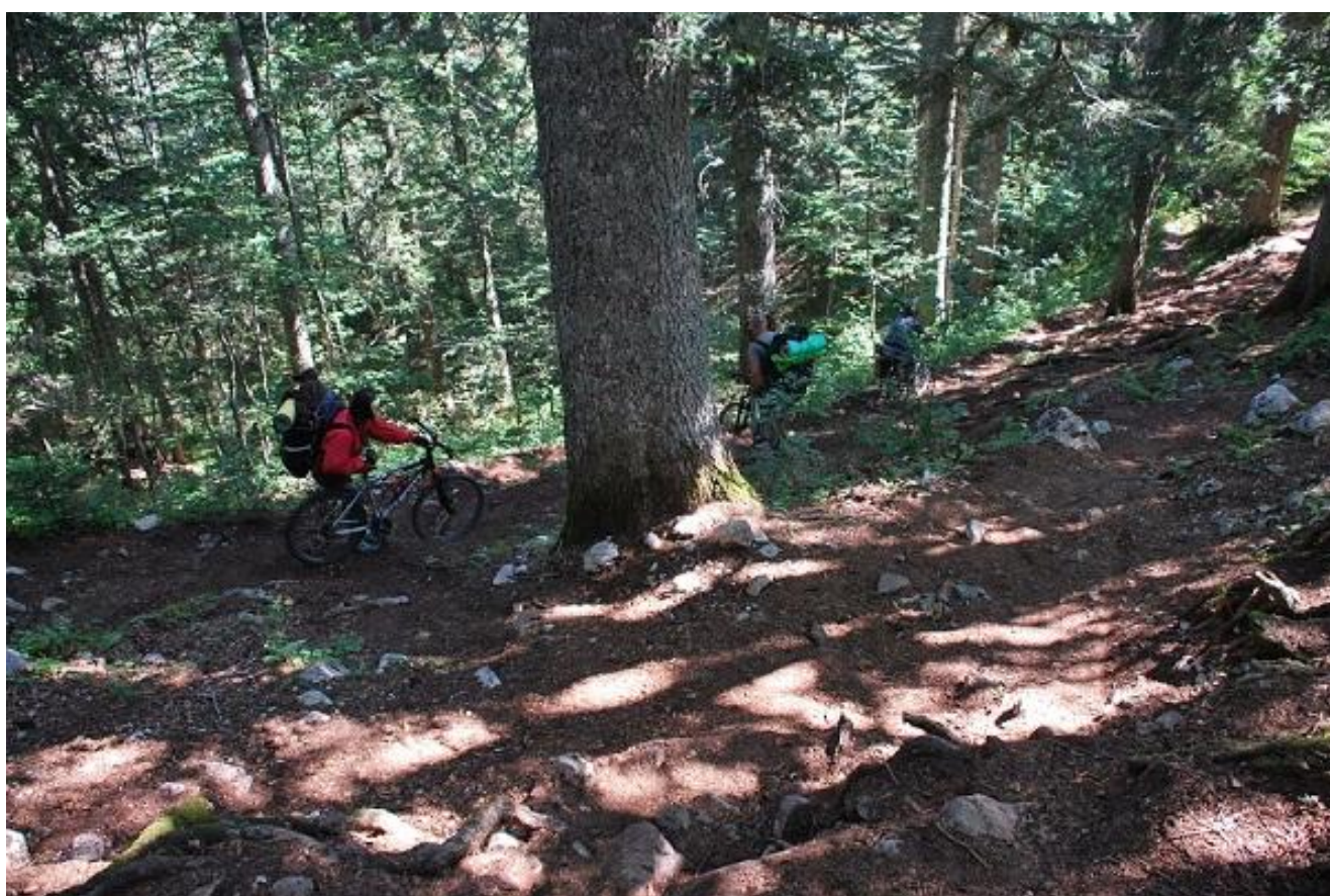
Фото 56. Начало спуска по лесной тропе к Ivan-Do.