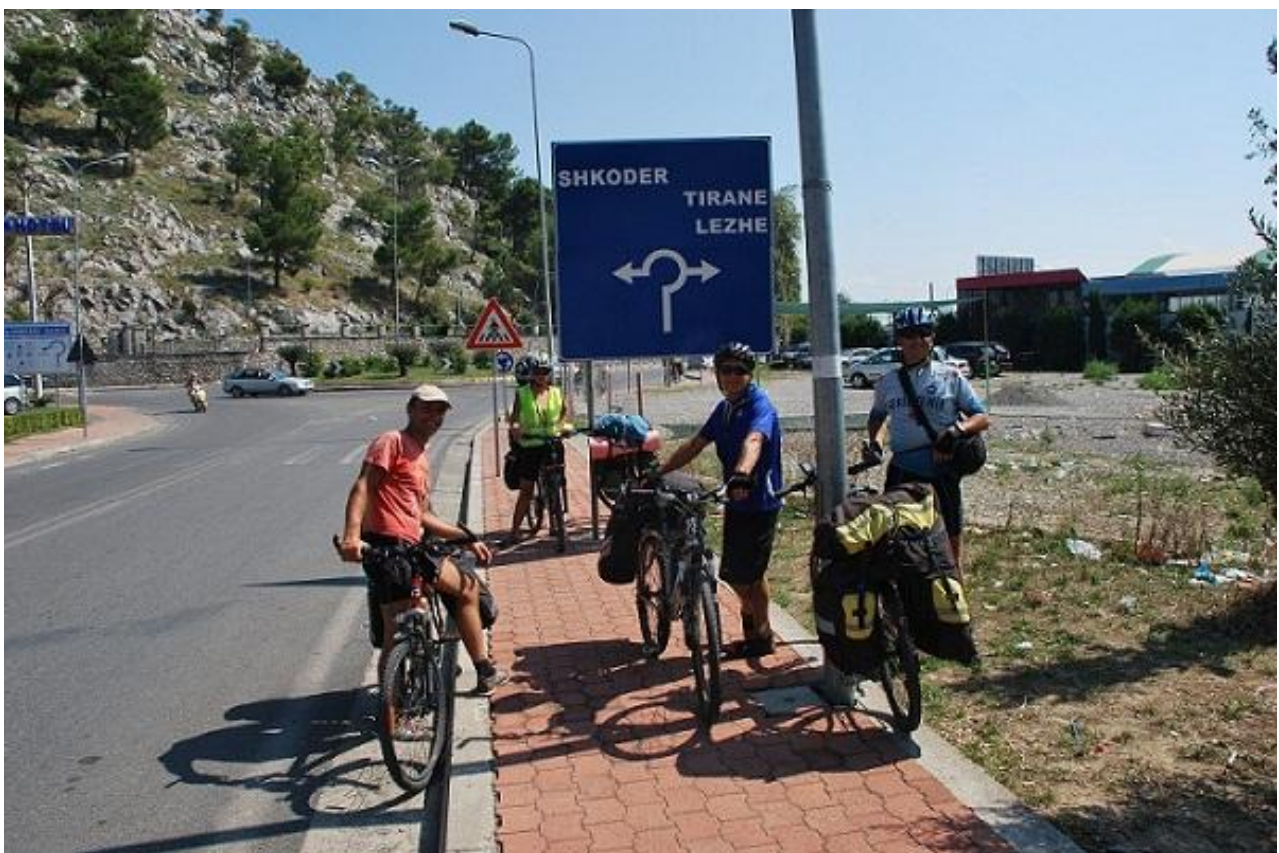
Фото 108. Указатель дорог перед въездом в Shkoder.