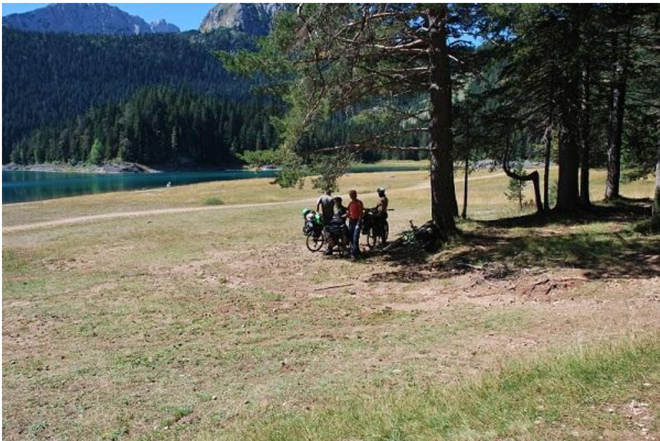
Фото 57. Выход из леса к Черному озеру и национальному парку Черное озеро.