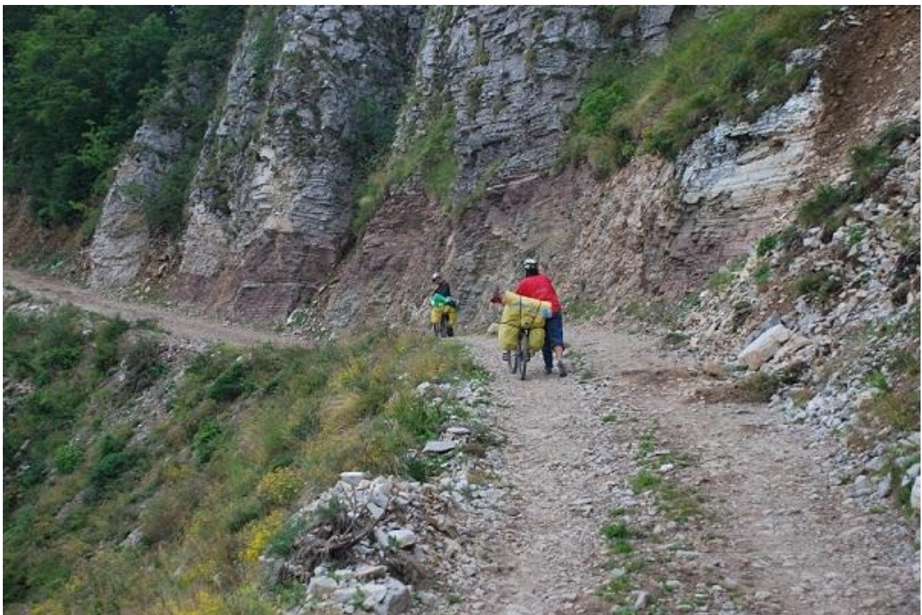
Фото 78. Участок грунтовой дороги Катун Vranjak – Krivi Do.