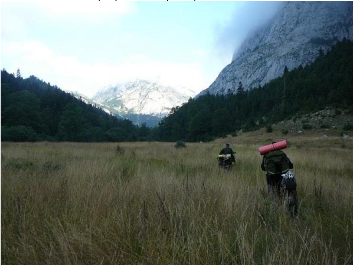
Фото 34. Выход в долину каньона р. Комарница.