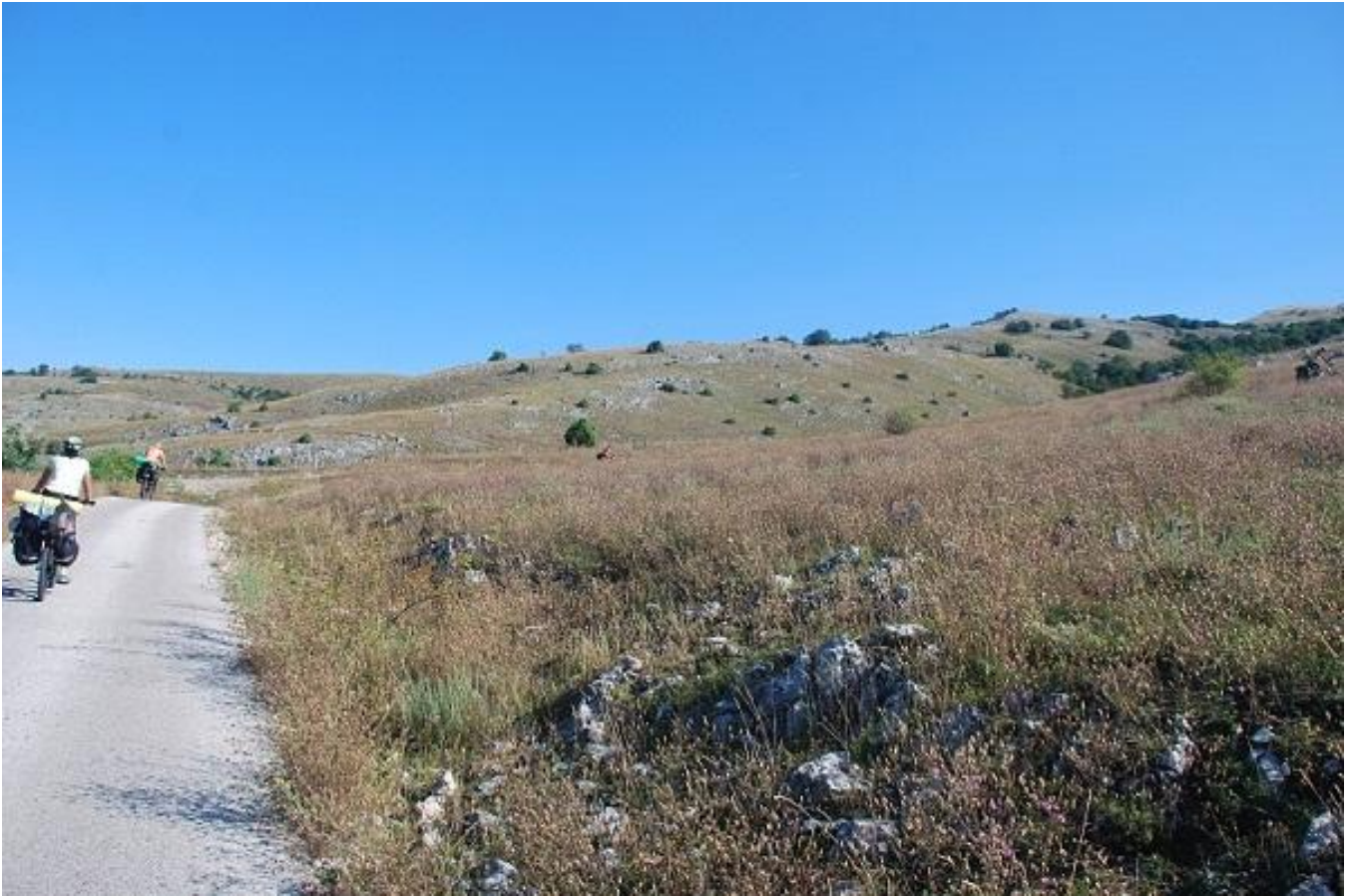
Фото 23. Выезд из поселка Вејие.