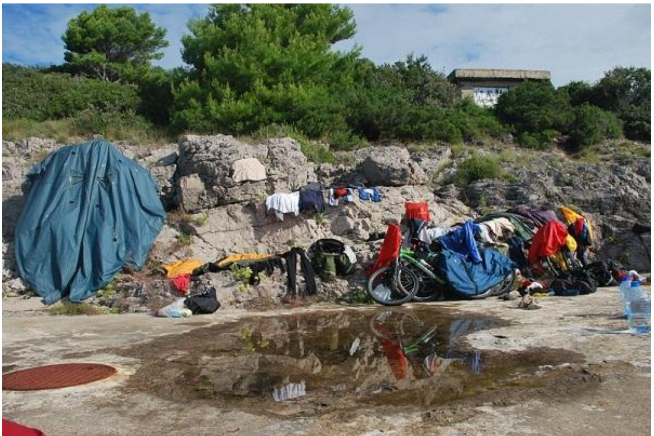
Фото 102. Остановка на ночлег на бетонной площадке возле моря в заливе за Tivat.