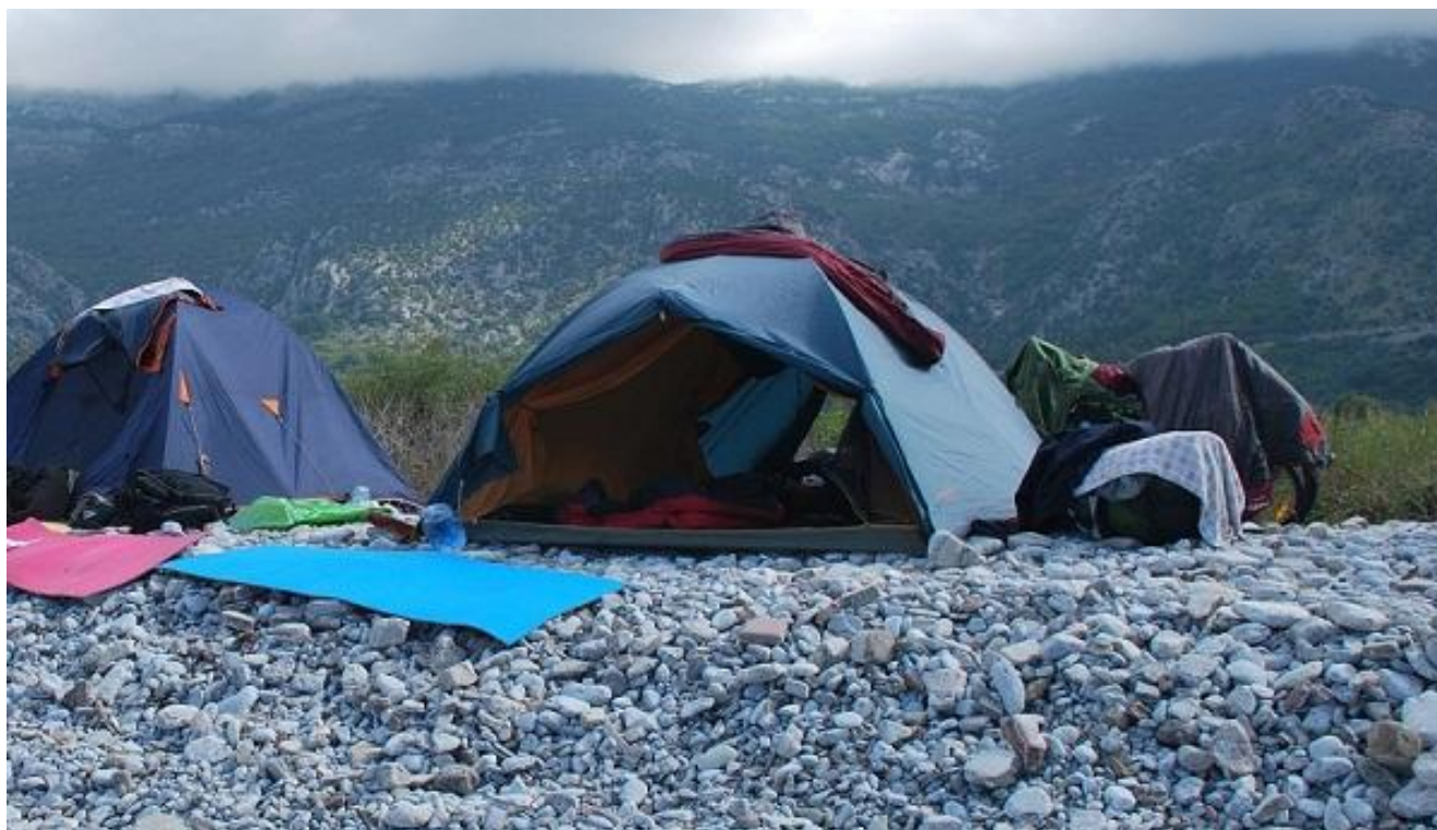
Фото 105. Остановка на ночлег на берегу моря перед Улцињ.