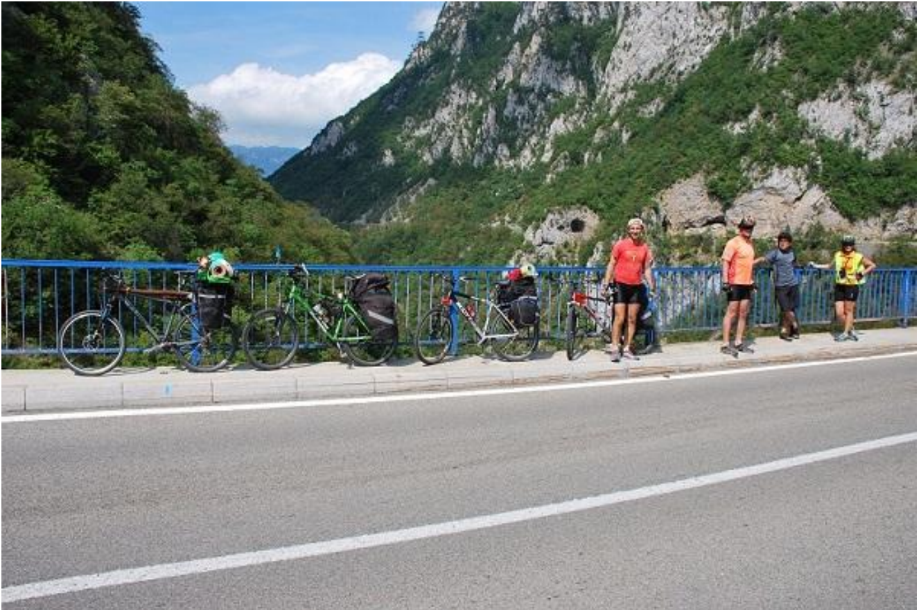
Фото 11. Мост через каньон р. Рива.