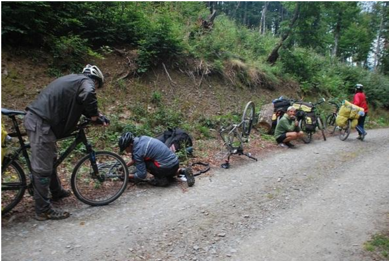
Фото 79. Ремонт. Замена пробитой камеры.