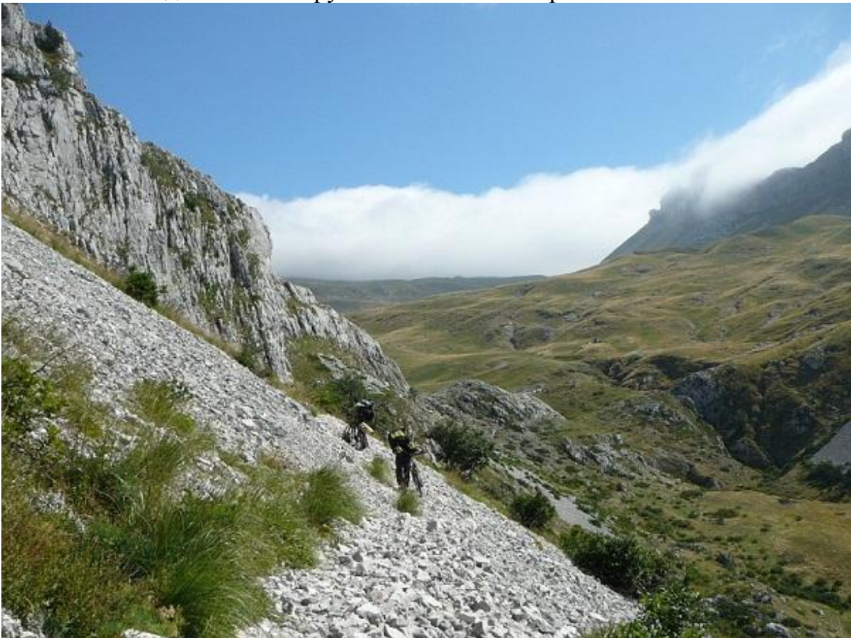
Фото 38. Участок каменной тропы на крутом склоне каньона р. Комарница.