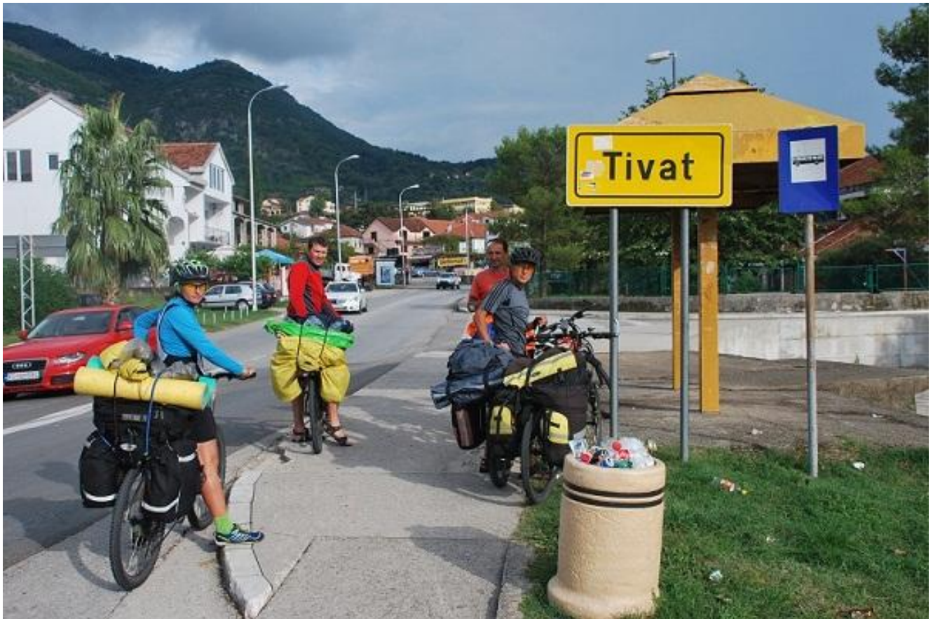
Фото 101. Tivat.