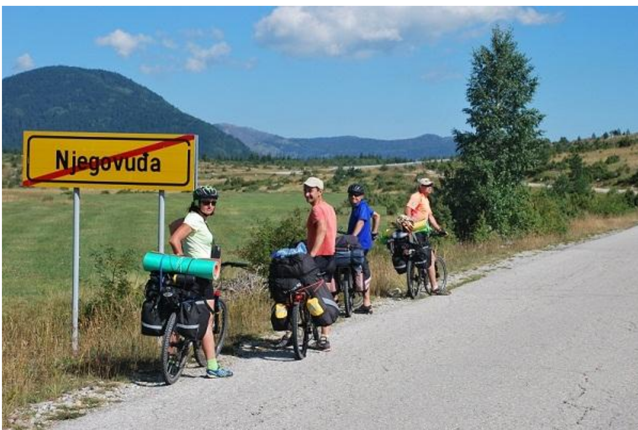
Фото 64. Njegovuda, указатель на выезде.