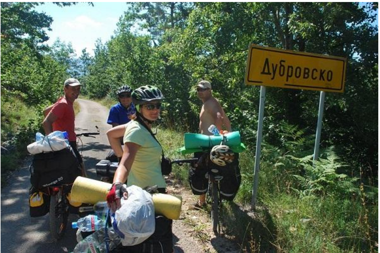
Фото 26. Dubrovsko.