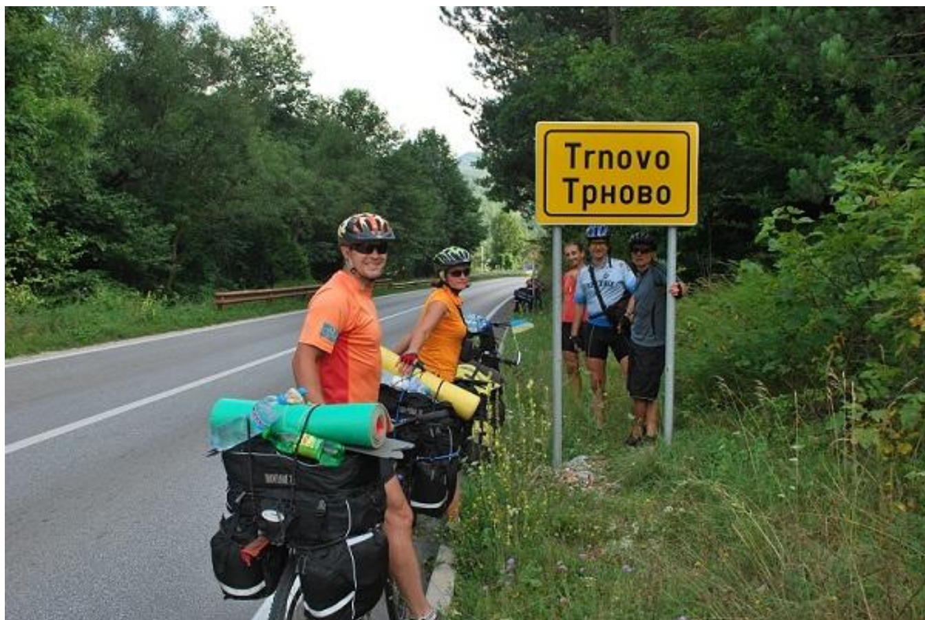
Фото 3. Трново.