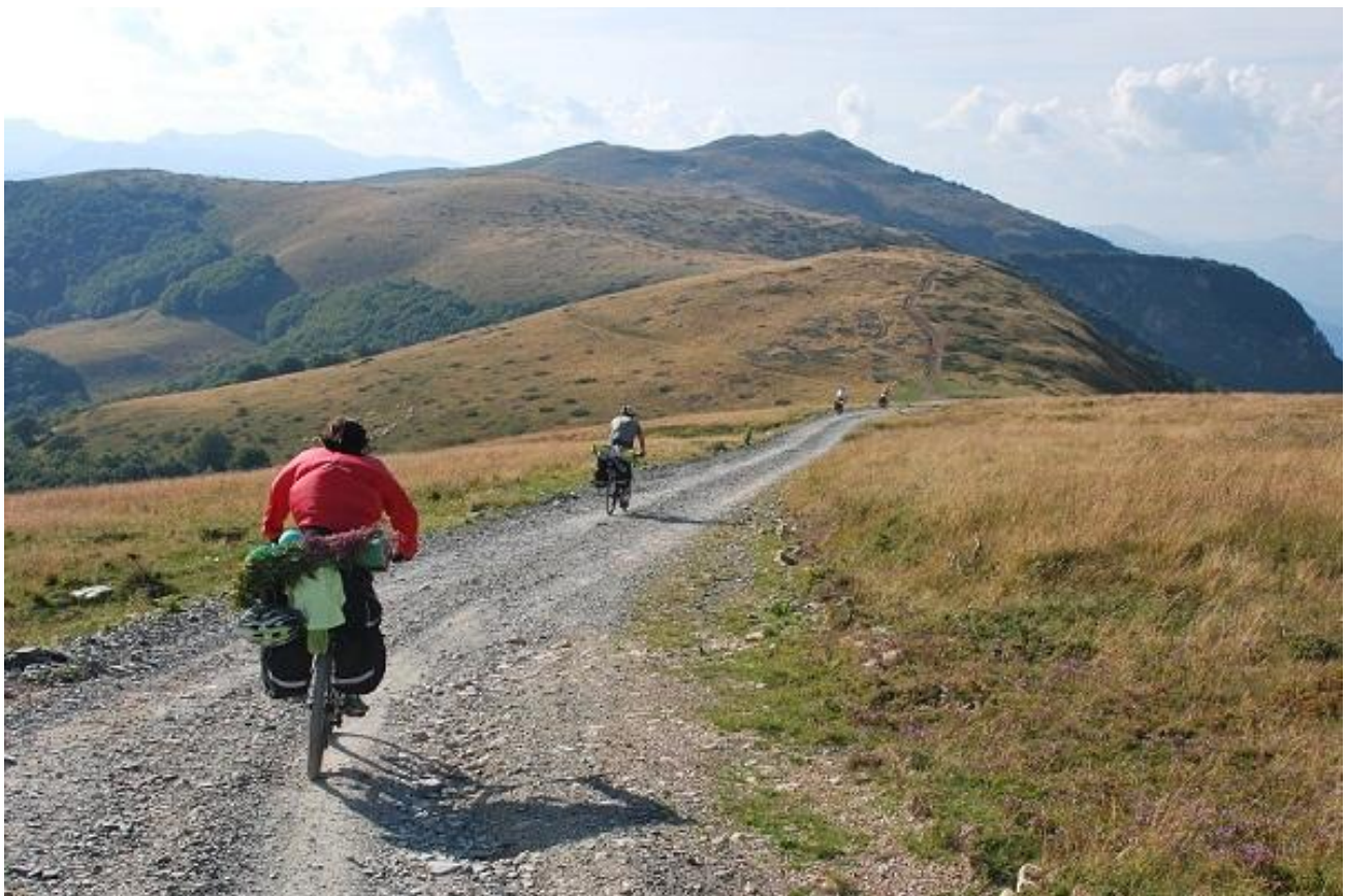
Фото 76. Учество дорочи перевал Биоградска гора – Катун Вранјак.