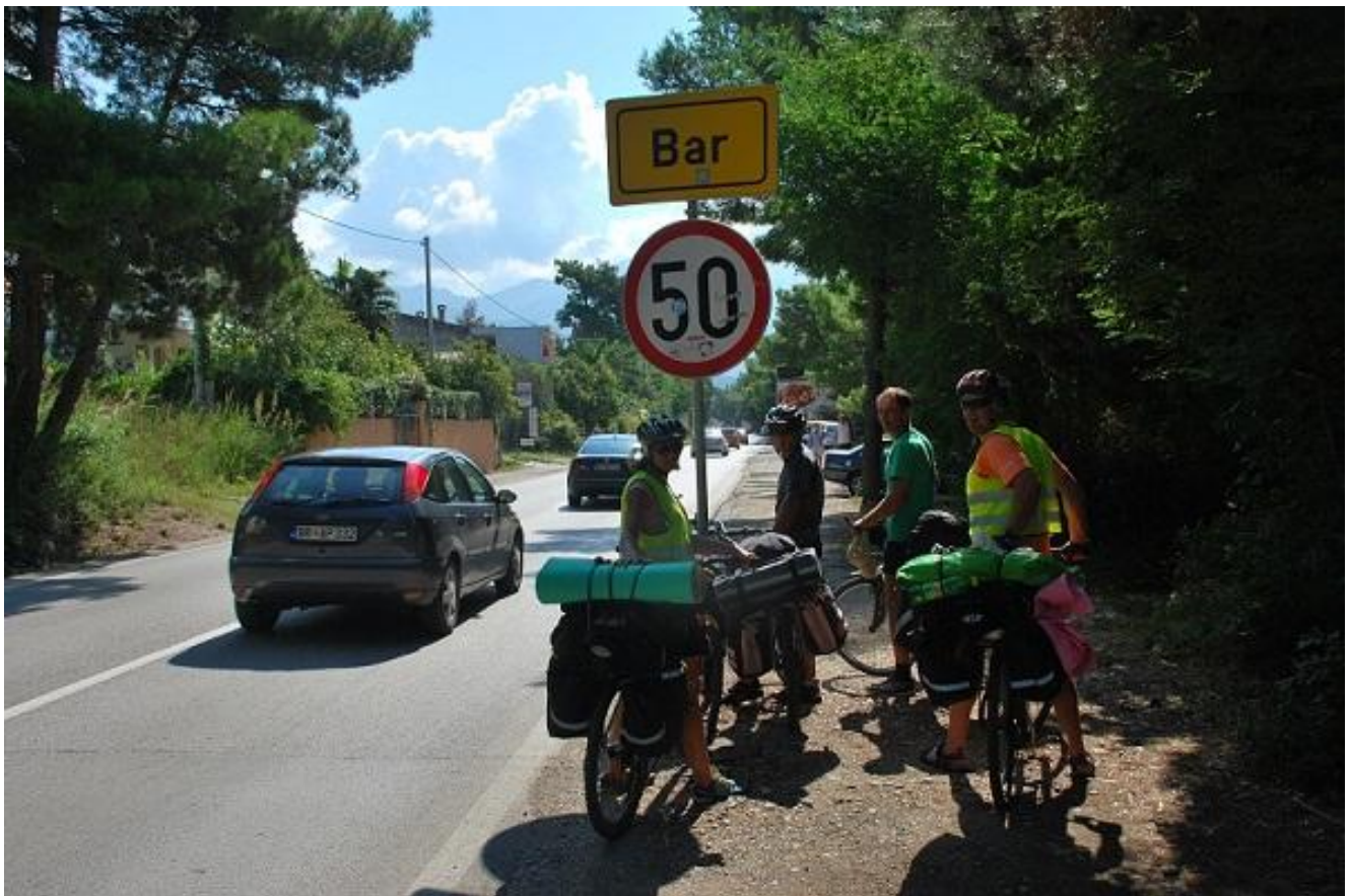
Фото 104. Bar.