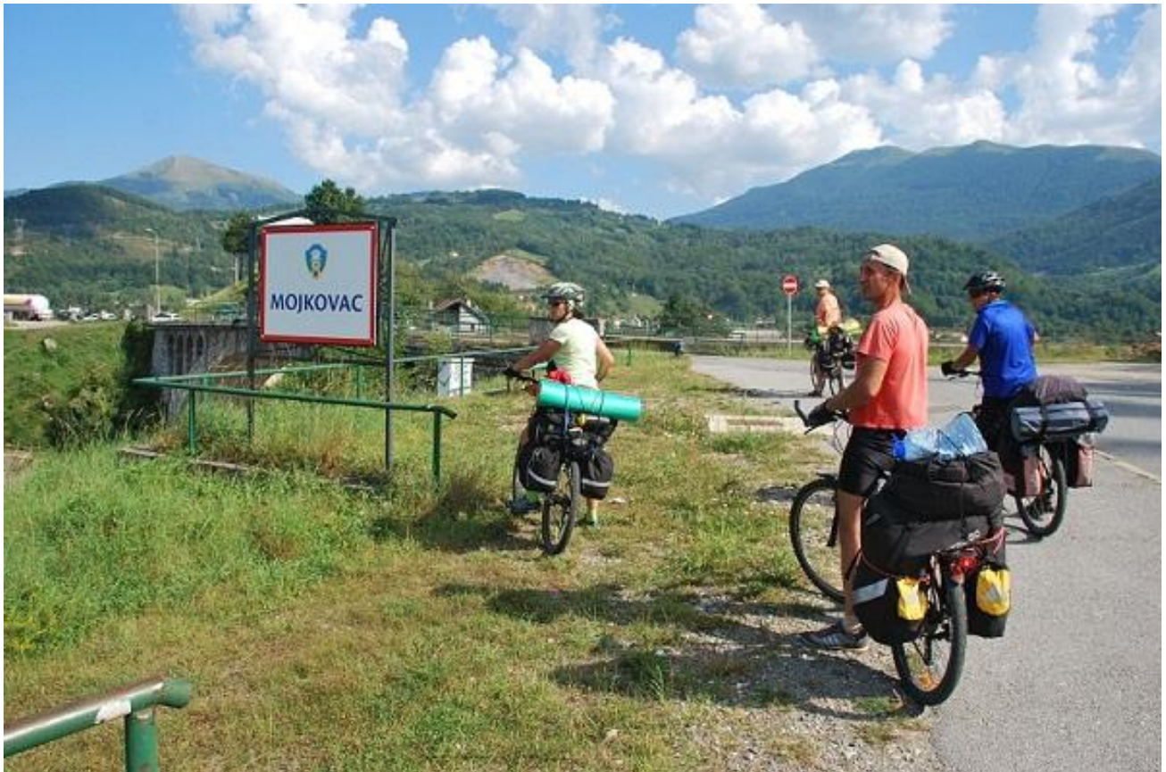
Фото 67. Мојковас. Указатељ на вјезде, вправо уходит дорога к оз. Biogradsko.