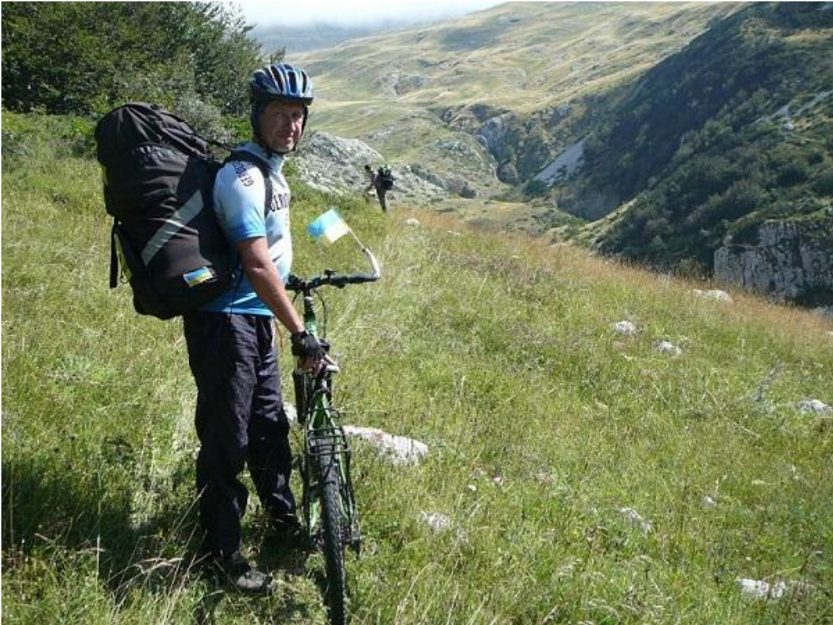
Фото 37. Выход из леса на крутой склон каньона р. Комарница.