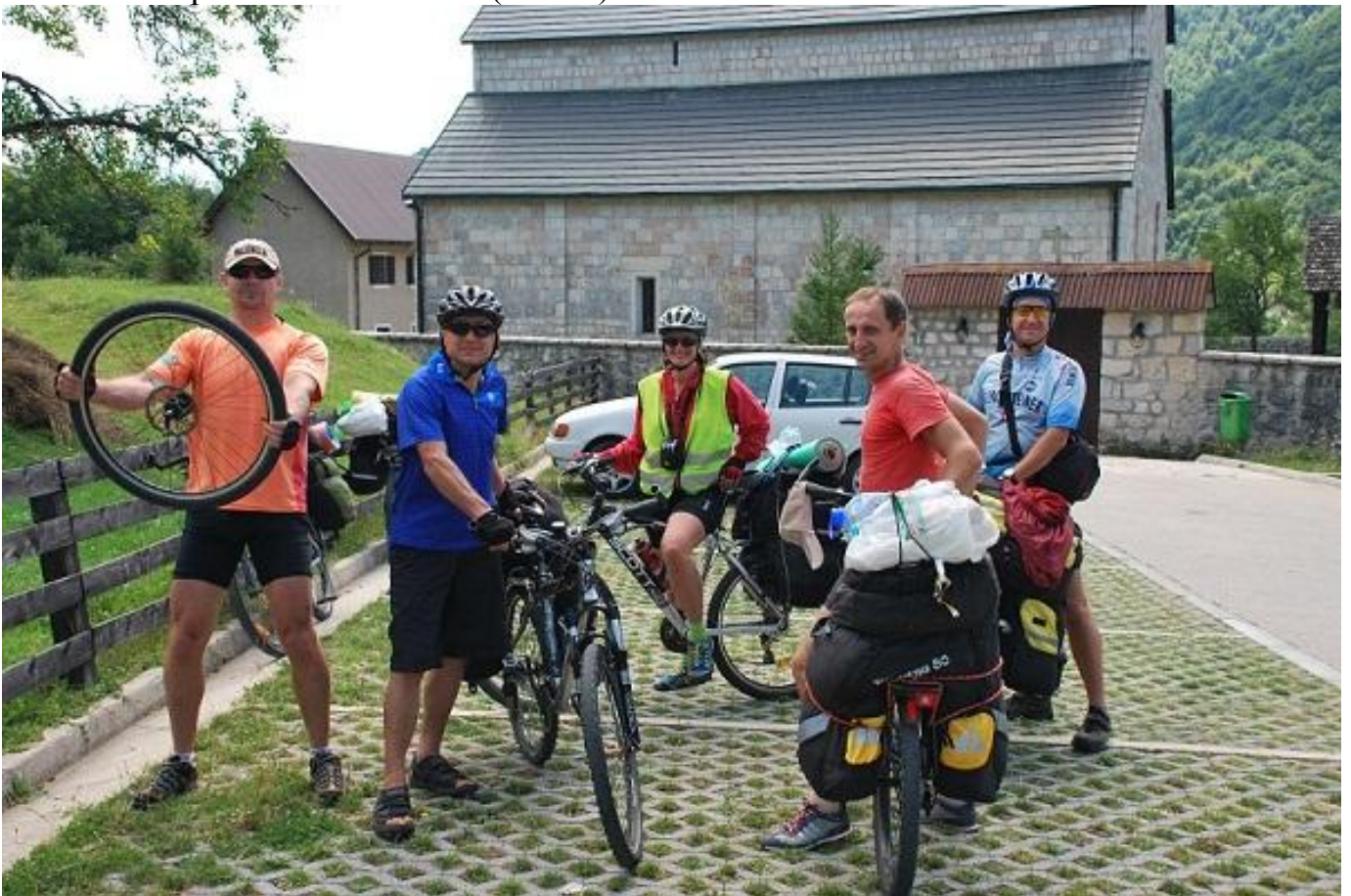
Фото 16. Пивский монастырь.