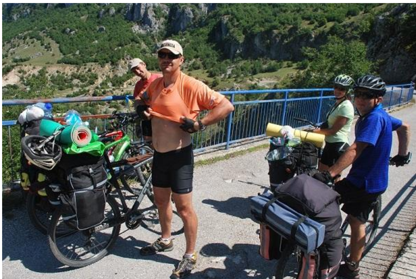
Фото 28. Мост через р. Komarnica.