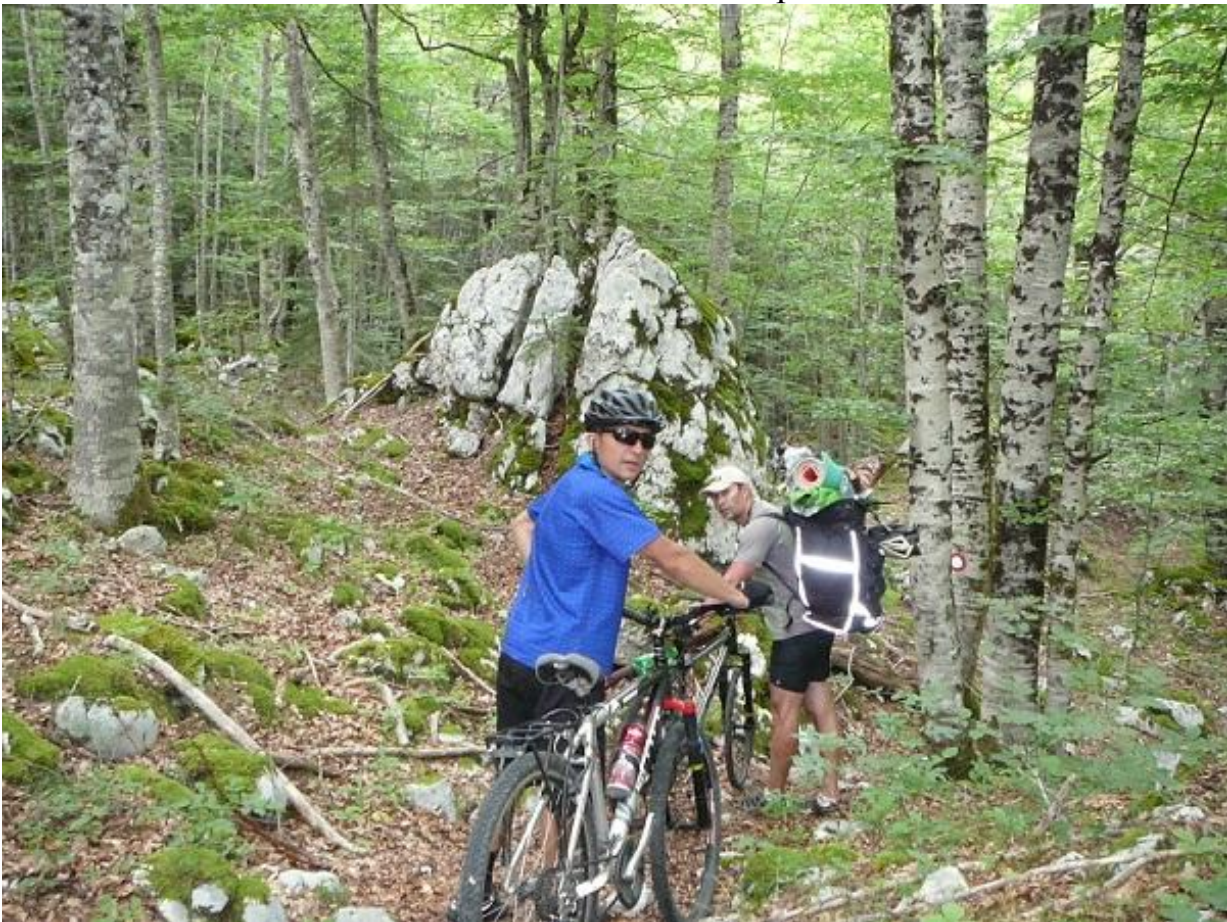
Фото 36. Участок лесной каменистой тропы каньон р. Комарница.