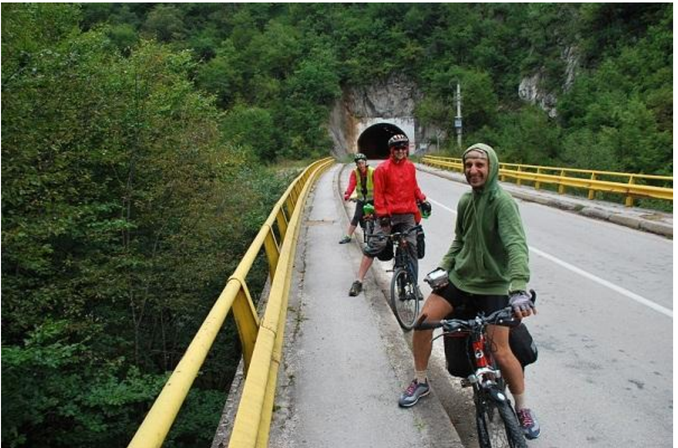
Фото 6. Тоннель. Участок дороги Трново – Нум.