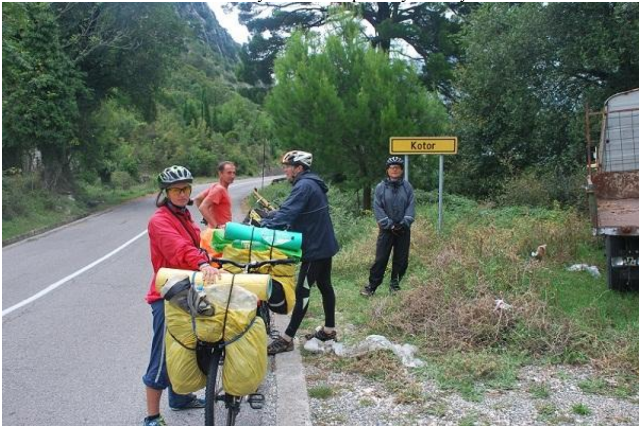
Фото 96. Kotor.