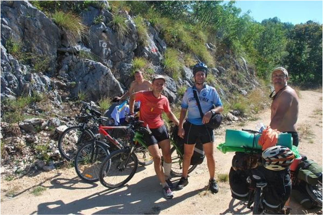
Фото 25. Перевал Драгалјево (1358).