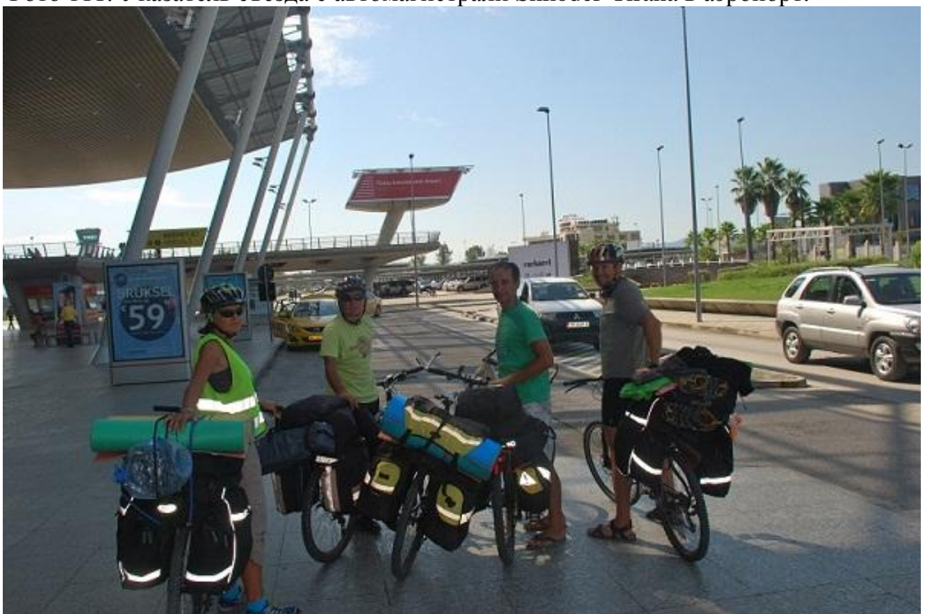
Фото 112. Международный аэропорт Rinas (Tirana). Конец маршрута.