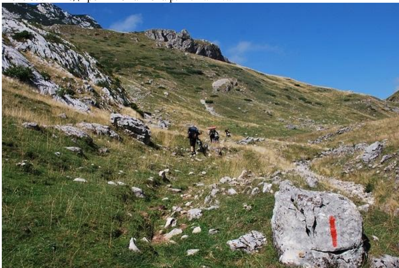
Фото 40. Участок маркированной тропы на перевал Sedlo.