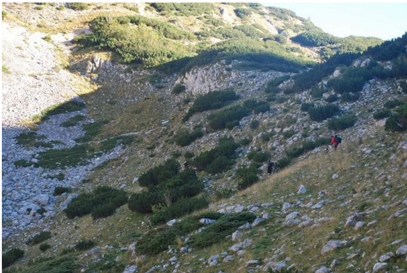
Фото 55. Участок тропы Losvice-Ivan-Do.