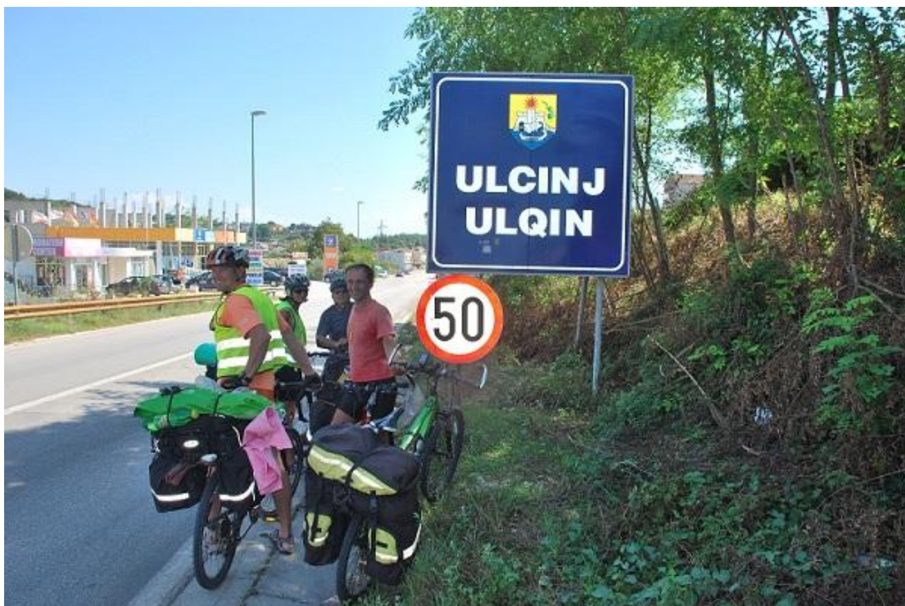
Фото 106. Улцињ.