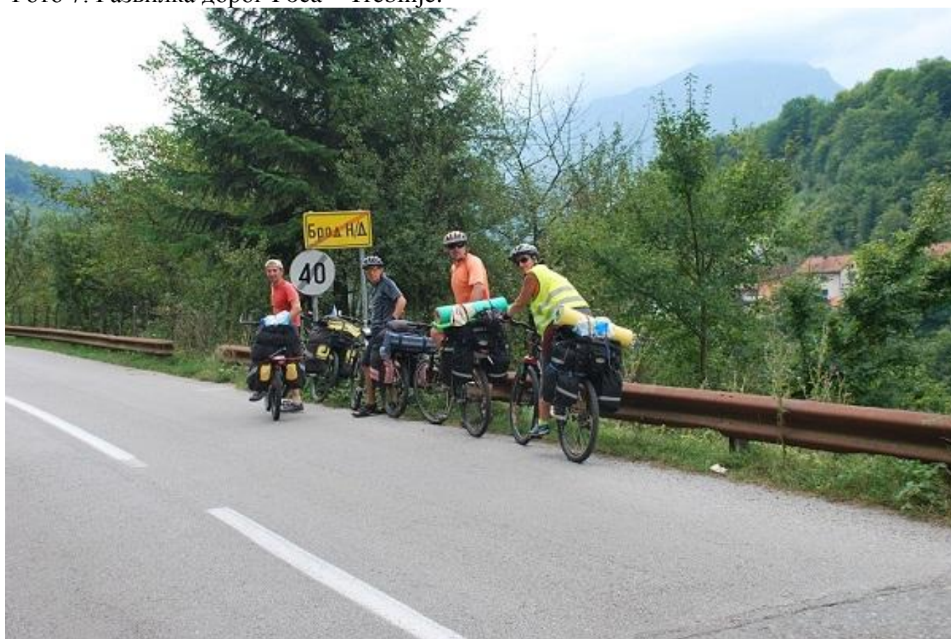
Фото 8. Брод. Указатељ на выезде за мостом.