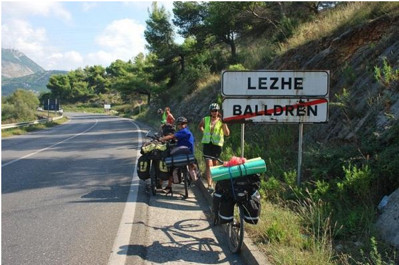
Фото 109. Lezhe.