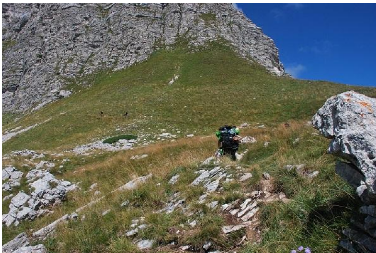
Фото 44. Начало крутой каменистой тропы на перевал Тројној.