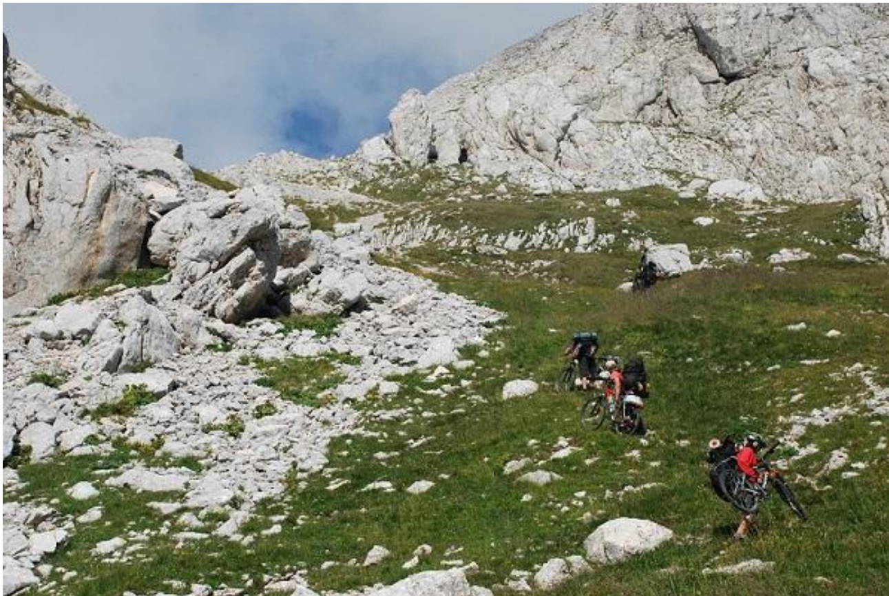
Фото 47. Участок подъема на перевал Тројној.