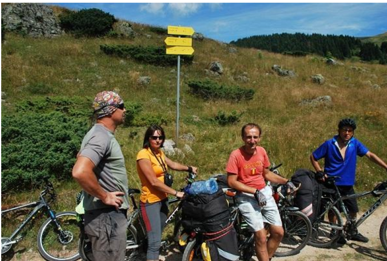
Фото 72. Выход на плато (1680м).