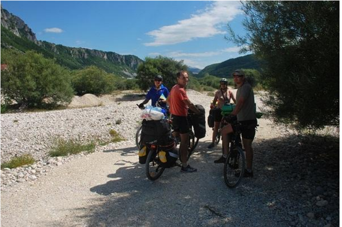
Фото 29. Начало грунтовой дороги при выезде из п. Комарница.