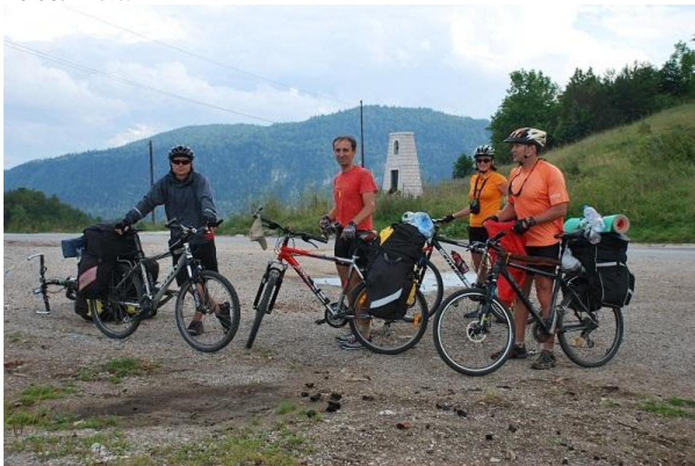
Фото 4. Перевал а/м 1170м.