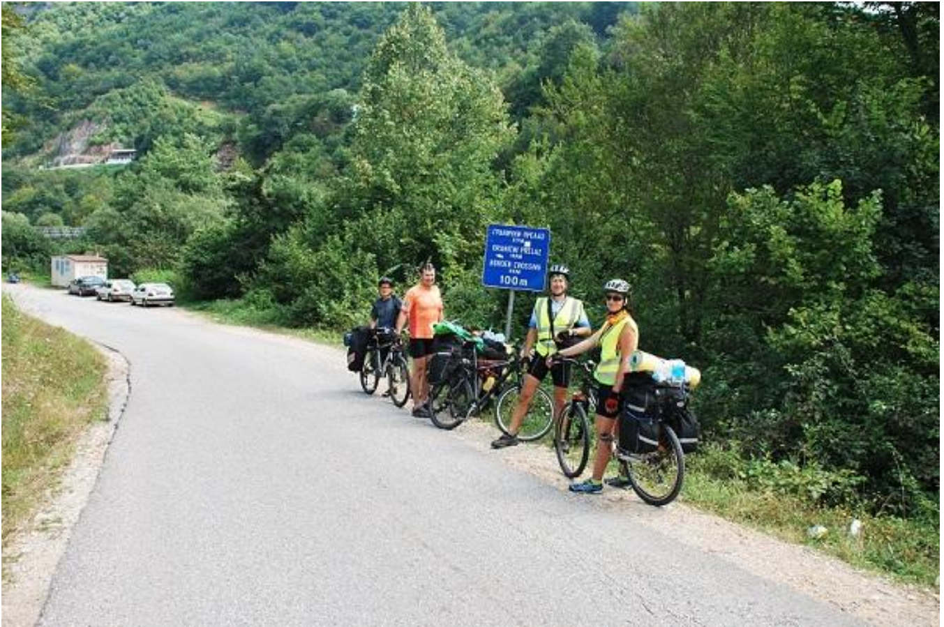
Фото 9. Граница перехода Боснии в Черногорию.