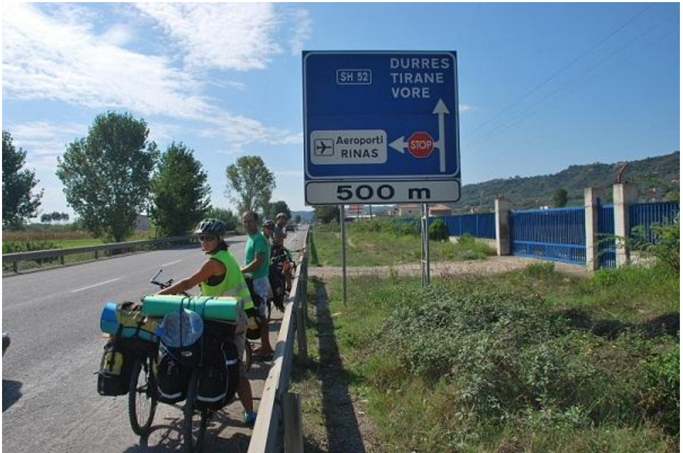
Фото 111. Указатель съезда с автомагистрали Shkoder-Tirana в аэропорт.