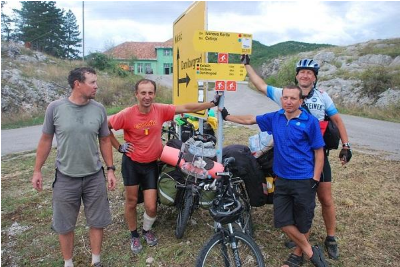
Фото 91. Сево. Указатель направлений дорог в центре поселка.