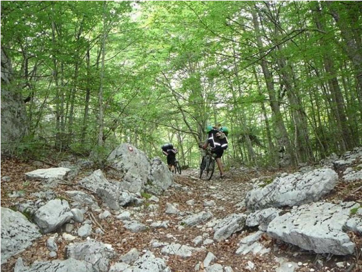
Фото 33. Участок маркированной тропы р. Комарница.