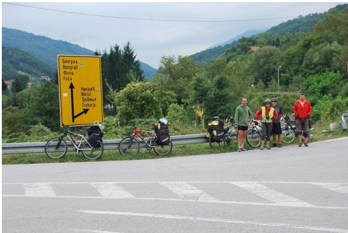
Фото 7. Развилка дорог Госа – Требиње.