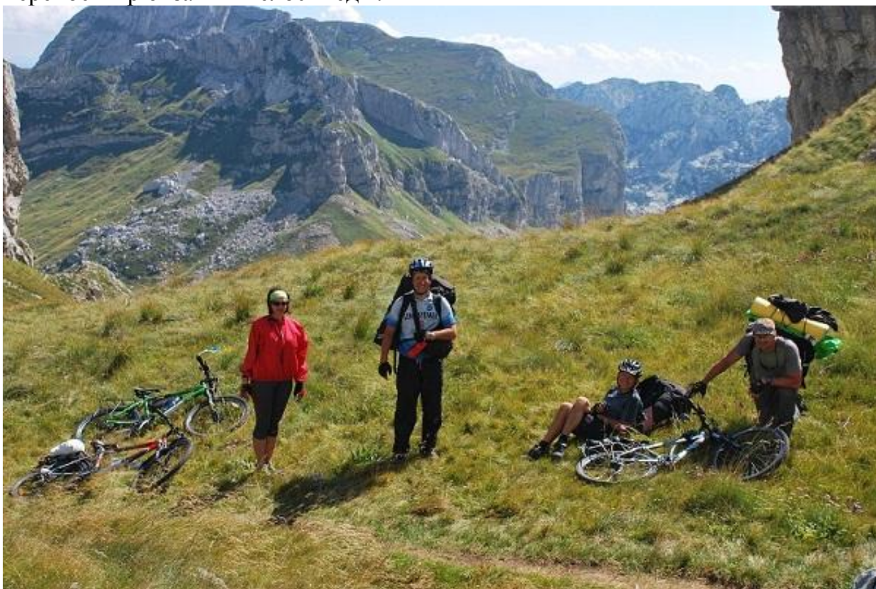
Фото 46. Выход на Uvida гряду (2020м).