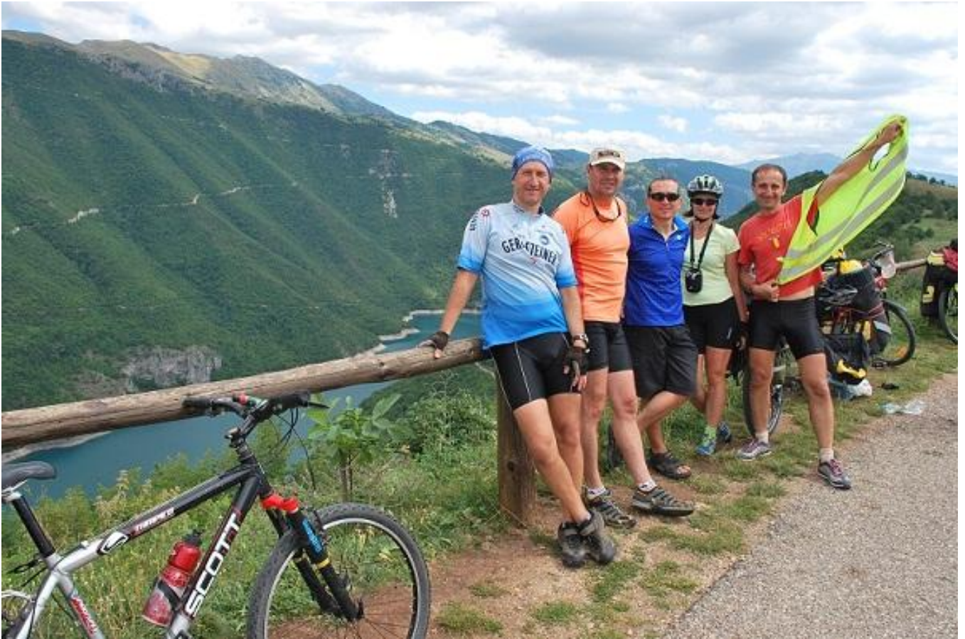
Фото 19. Вид на каньон р. Рива возле ресторана Izlazak (1000м).