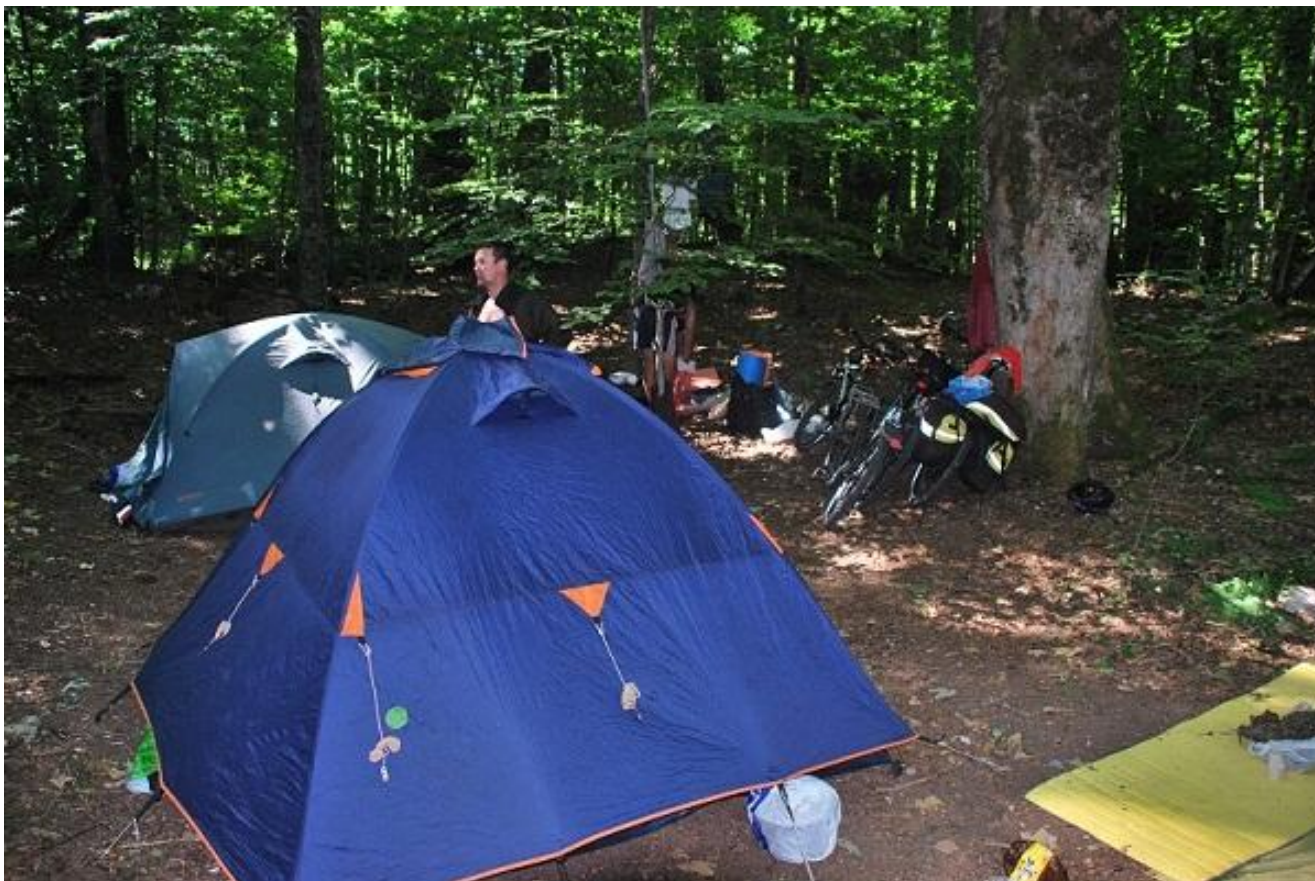
Фото 69. Остановка на ночлег в национальном парке Biogradsko jezero (1099м).