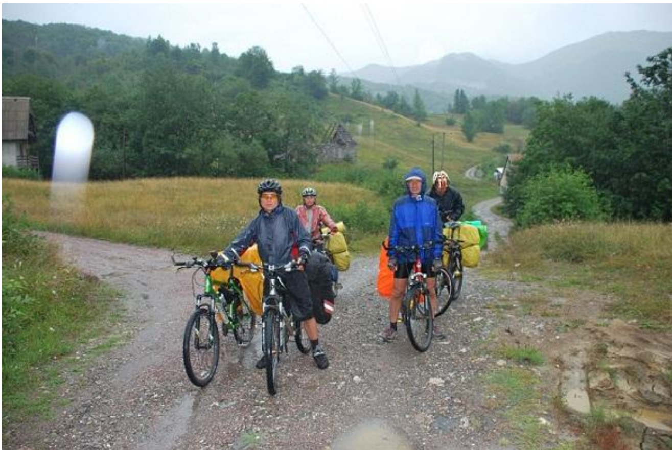
Фото 81. Krivi Do.