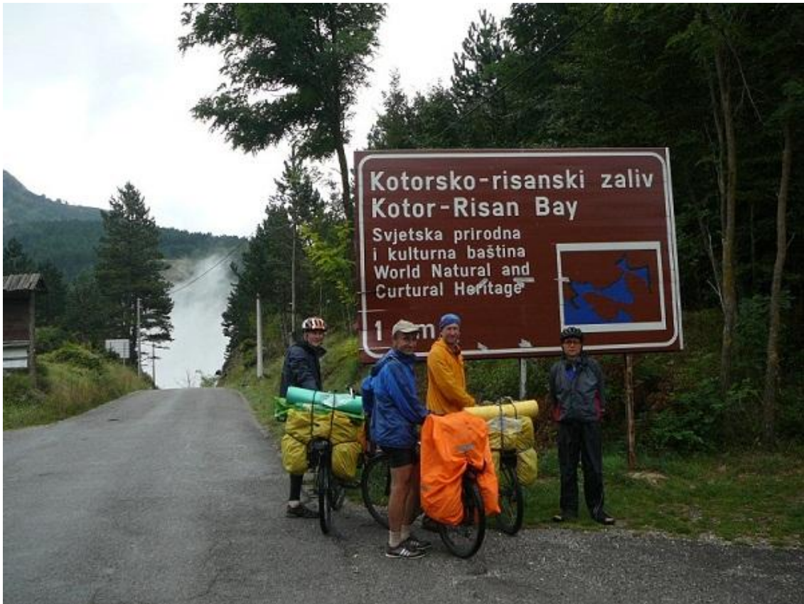
Фото 95. Указатель в начале спуска к Которскому заливу.