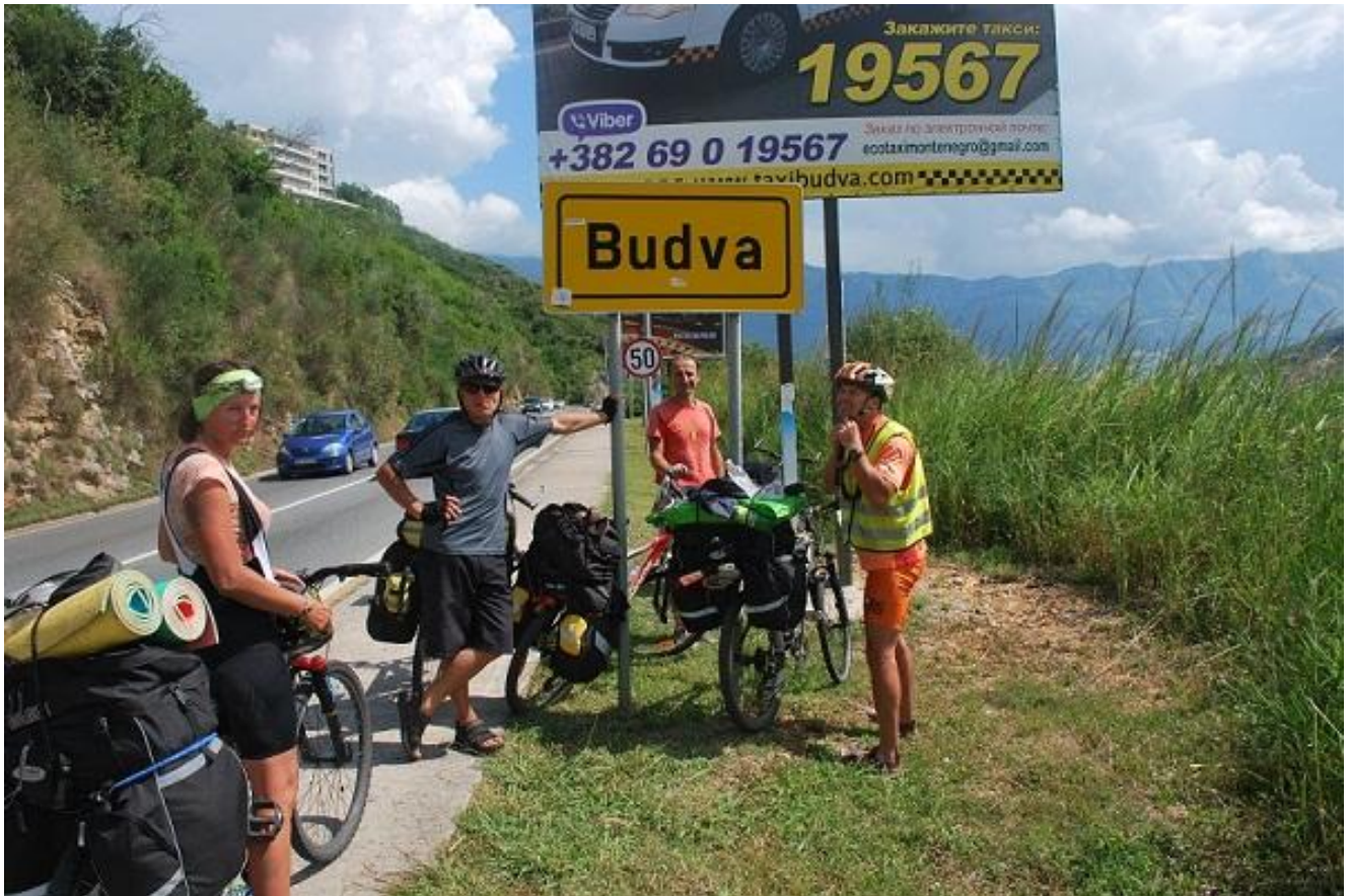
Фото 103. Budva.