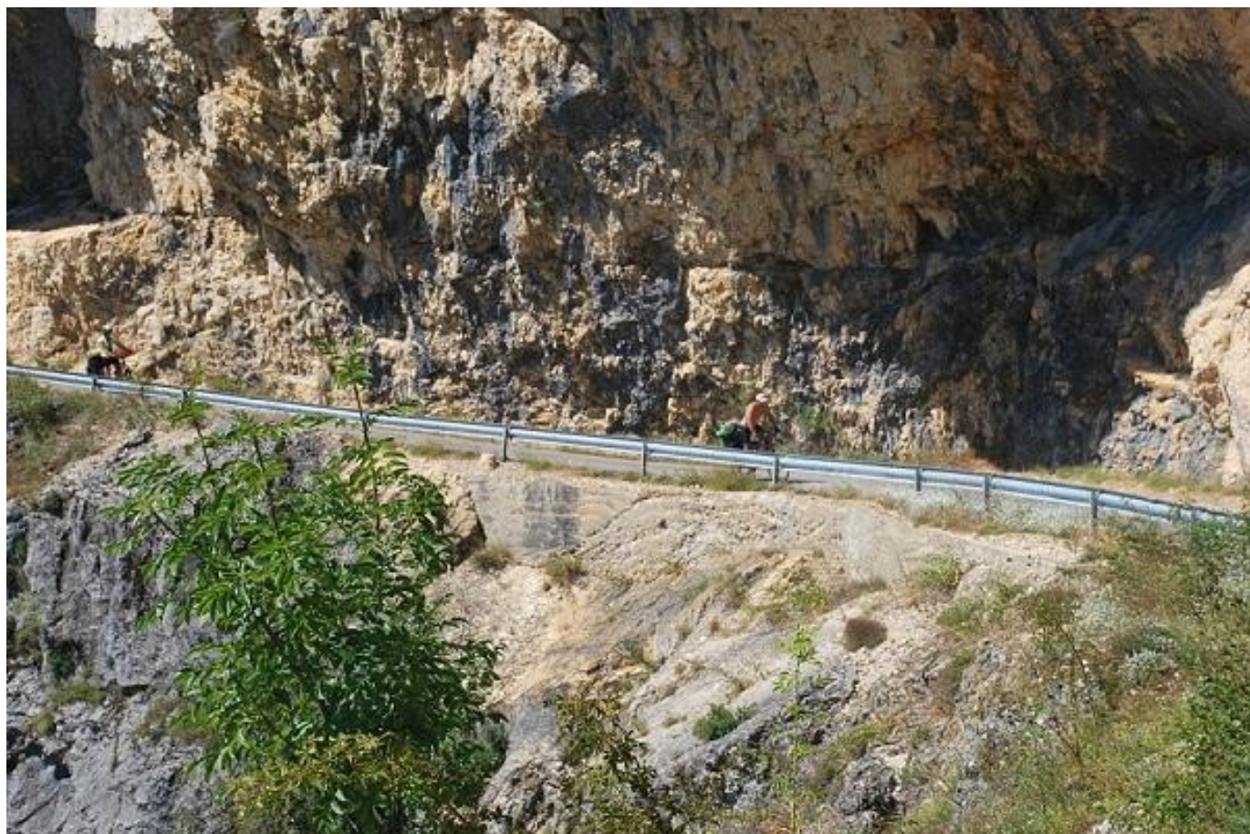
Фото 27. Участок дороги вдоль каньона Nevidio (Komarnica).