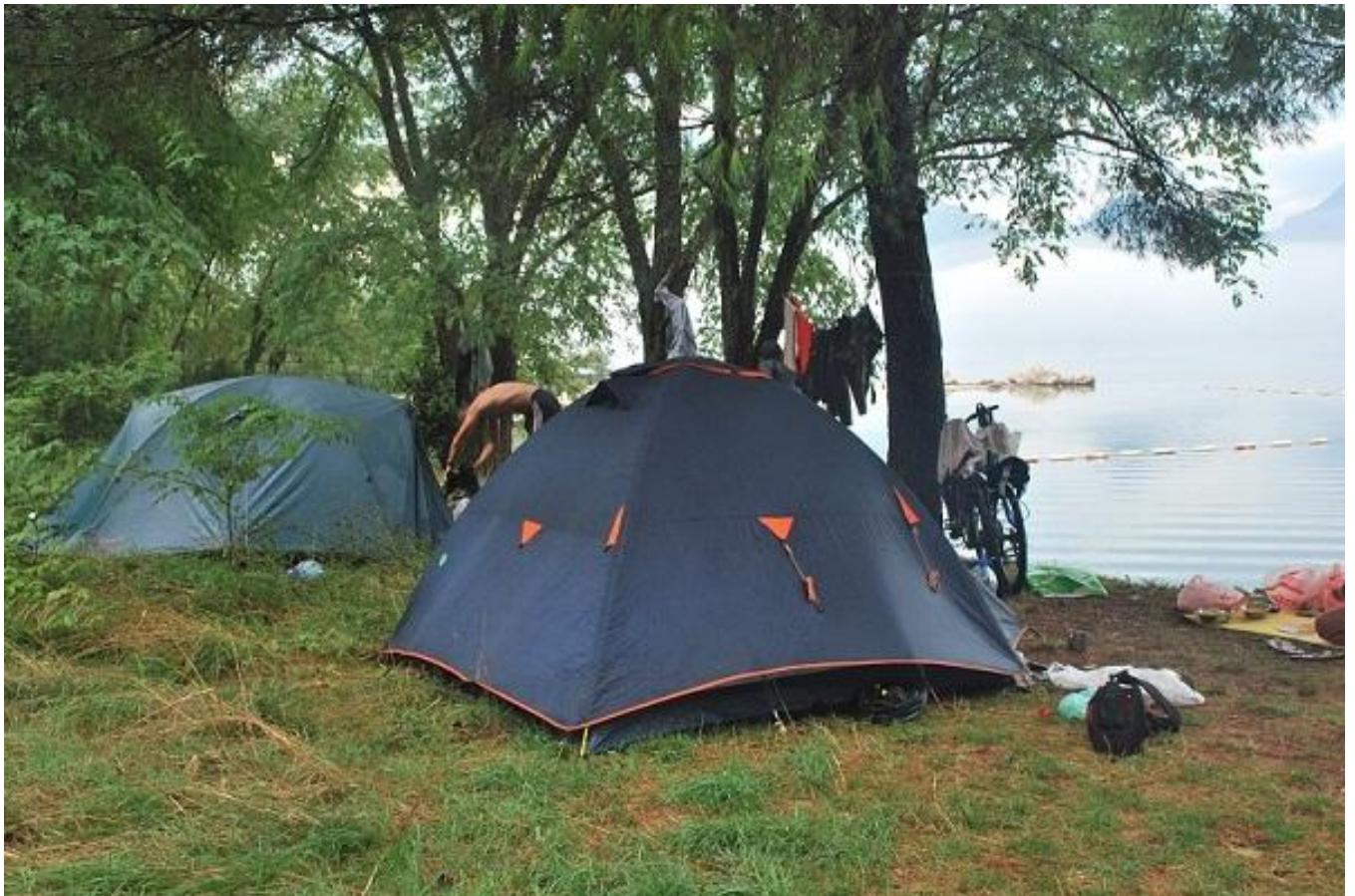
Фото 99. Остановка на ночлег на берегу моря Risan. ДНЕВКА.