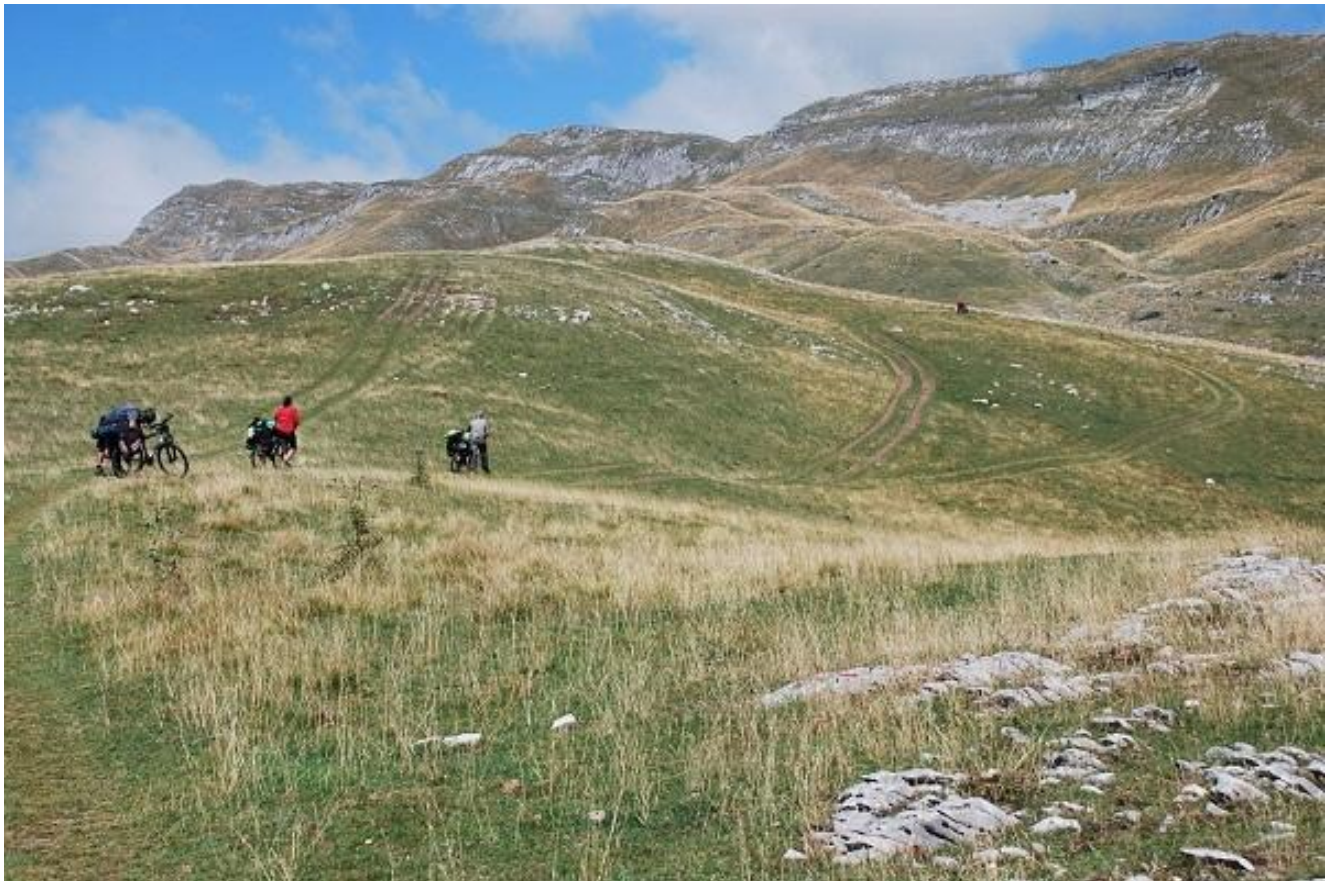
Фото 41. Тропа переходит в грунтовую дорогу, ведущую на перевал Sedlo.