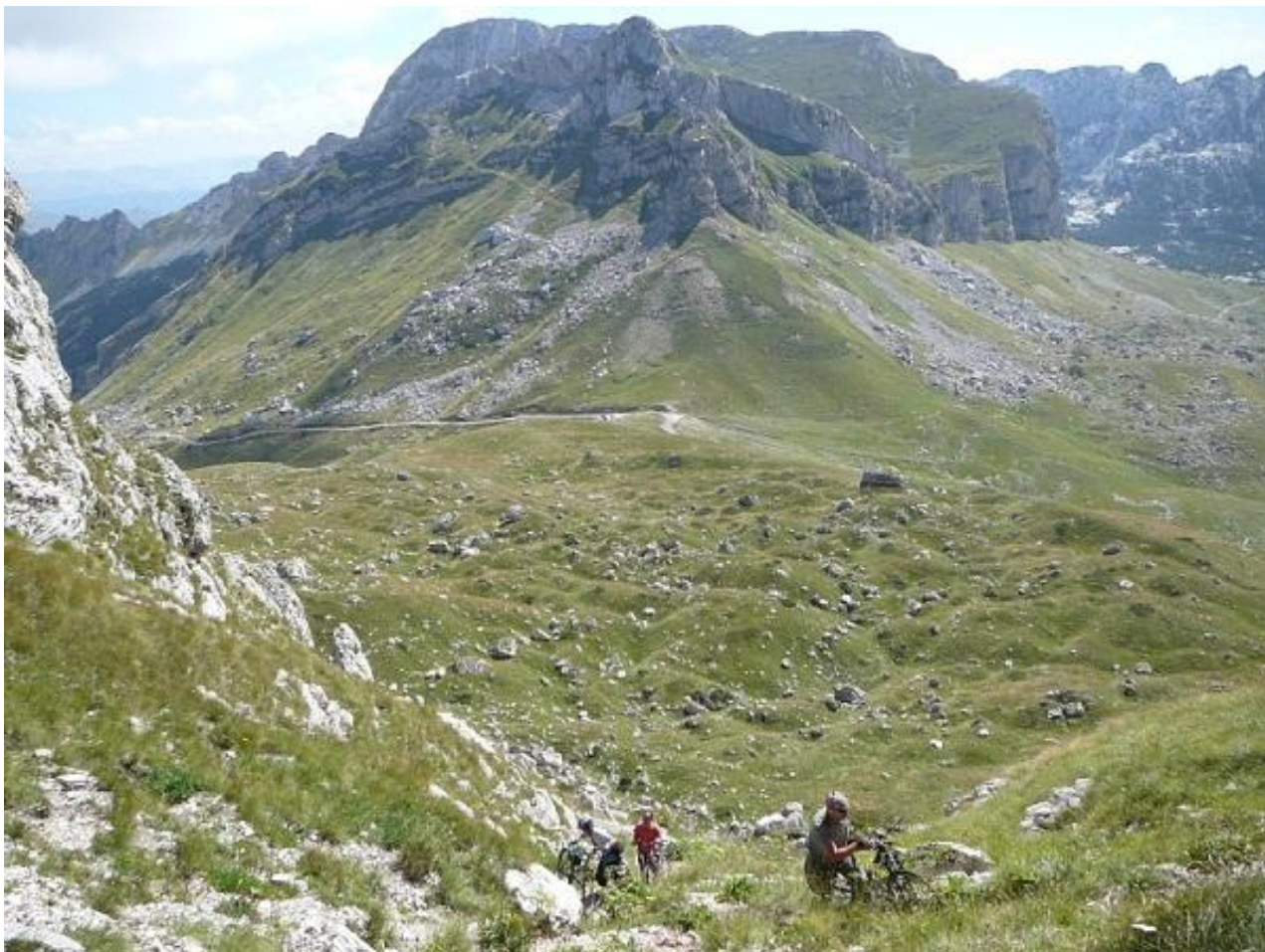
Фото 45. Участок крутого склона каменистой тропы на перевал Sedlo, поочередно переносим рюкзаки и велосипеды.