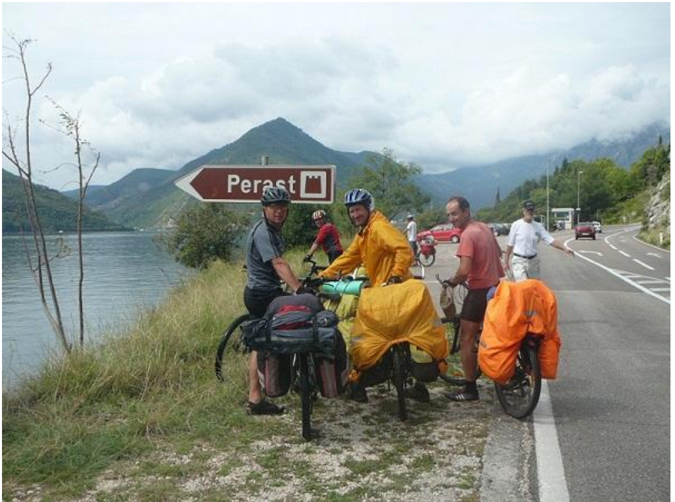
Φοτο 97. Perast.