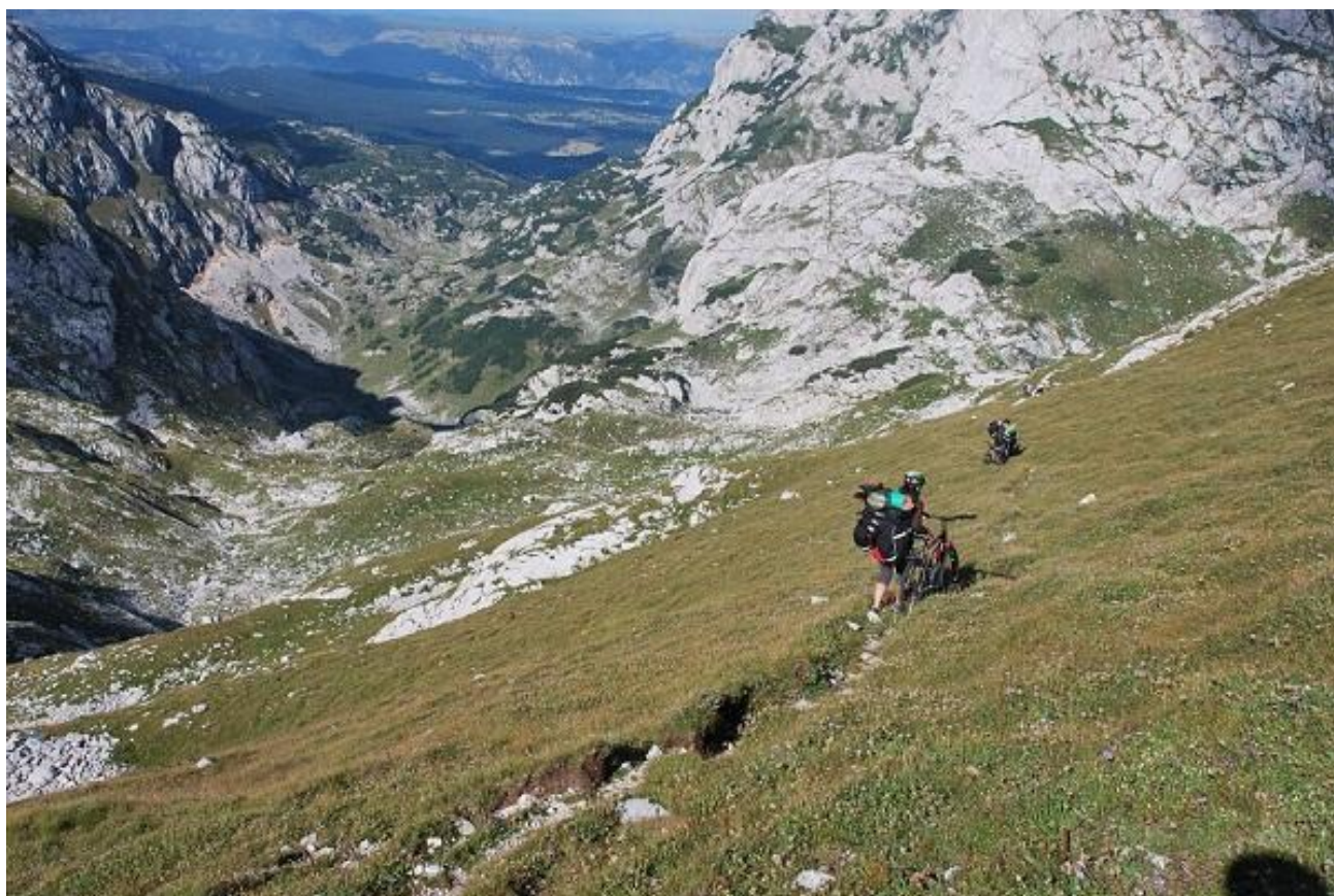
Фото 50. Начало спуска с перевала Тгојној.