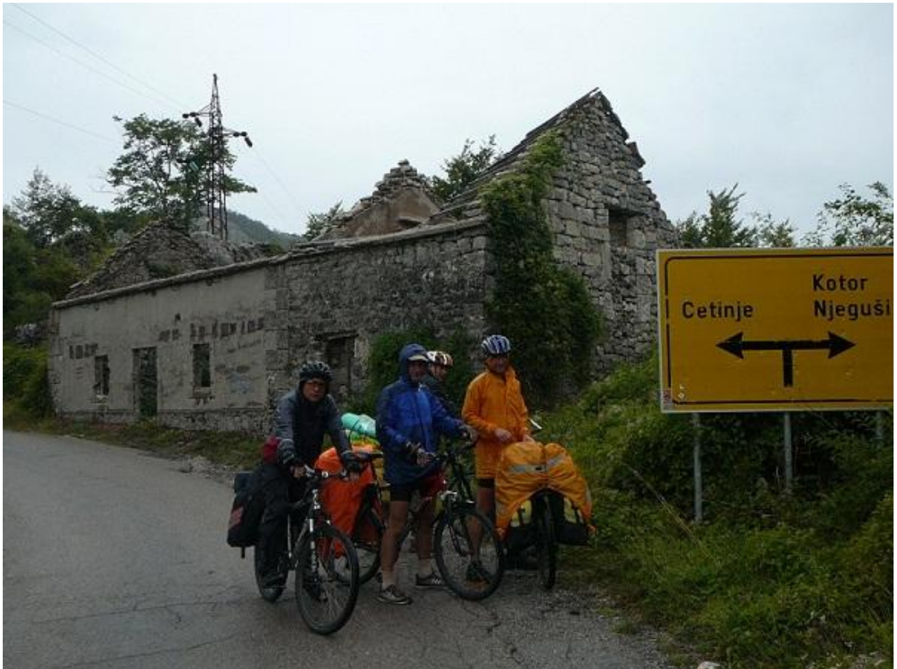
Фото 93. Развилка дорог перед а/м перевалом в Kotor.