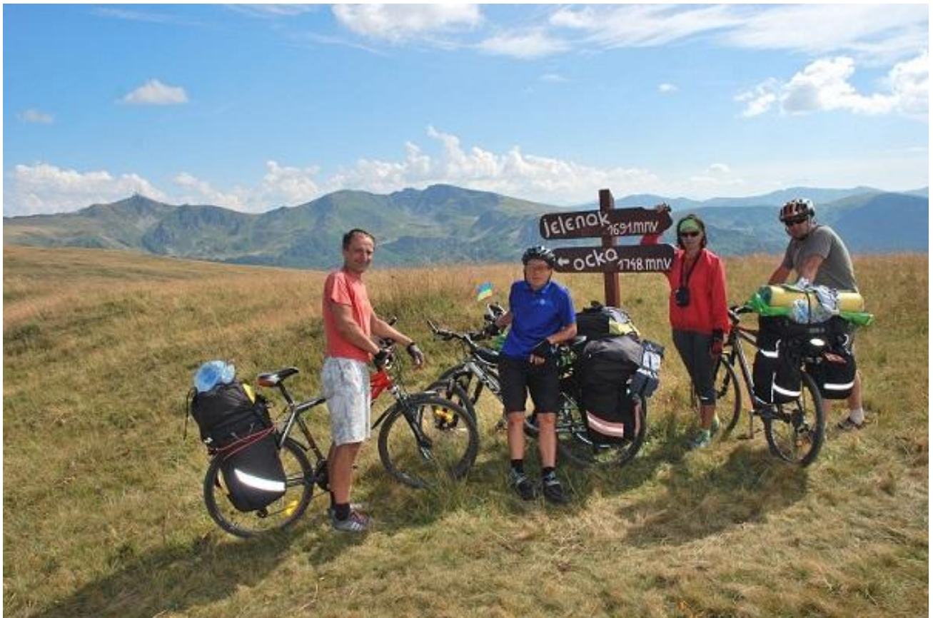
Фото 74. Участок дороги к перевалу Биградска гора. Указатель направлений.