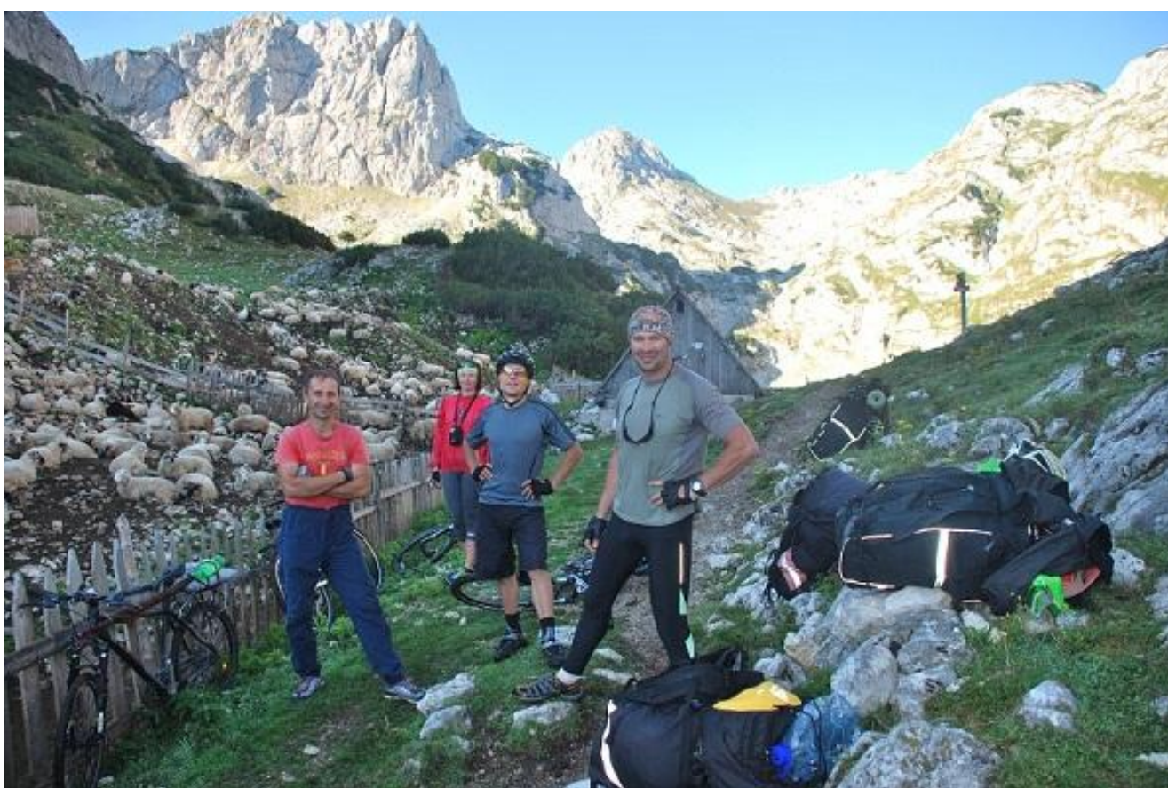
Фото 54. Katun Lokvice - пастуший дом и кемпинг.