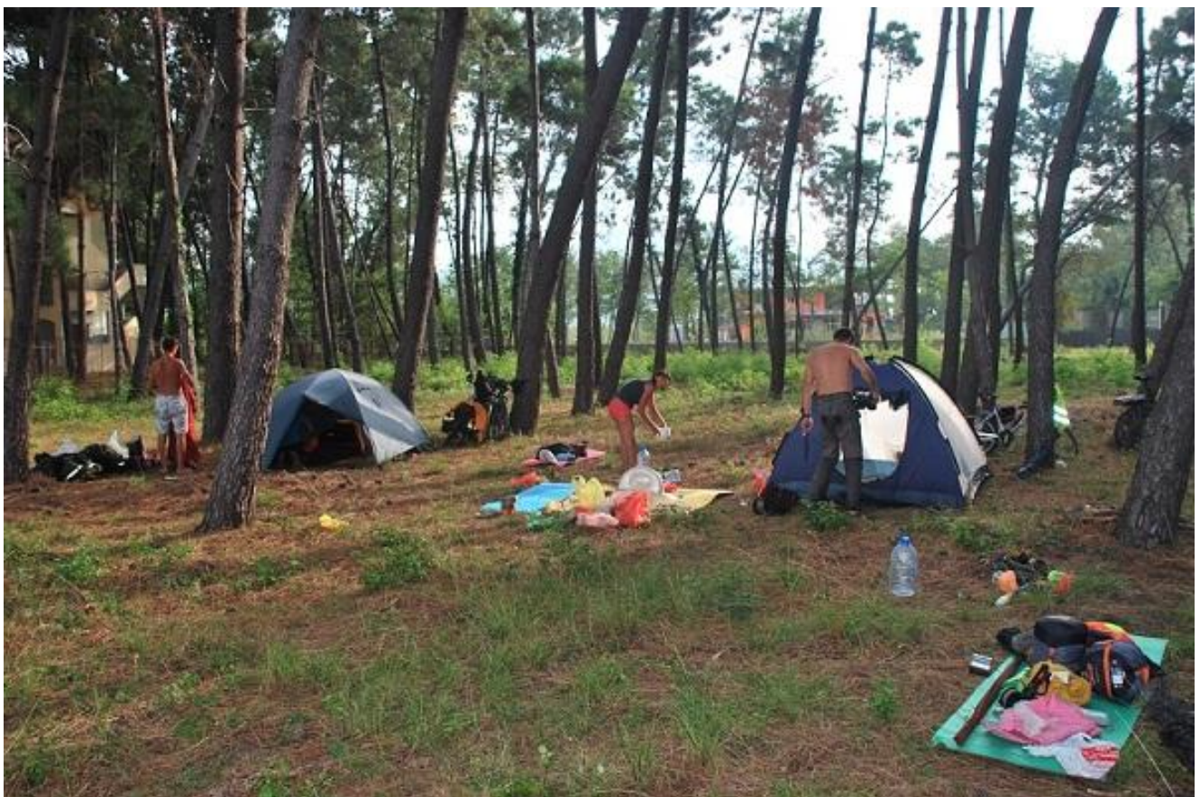
Фото 110 Остановка за Lezhe на нощлег в лесополосе возле моря на территории частного пансионата.