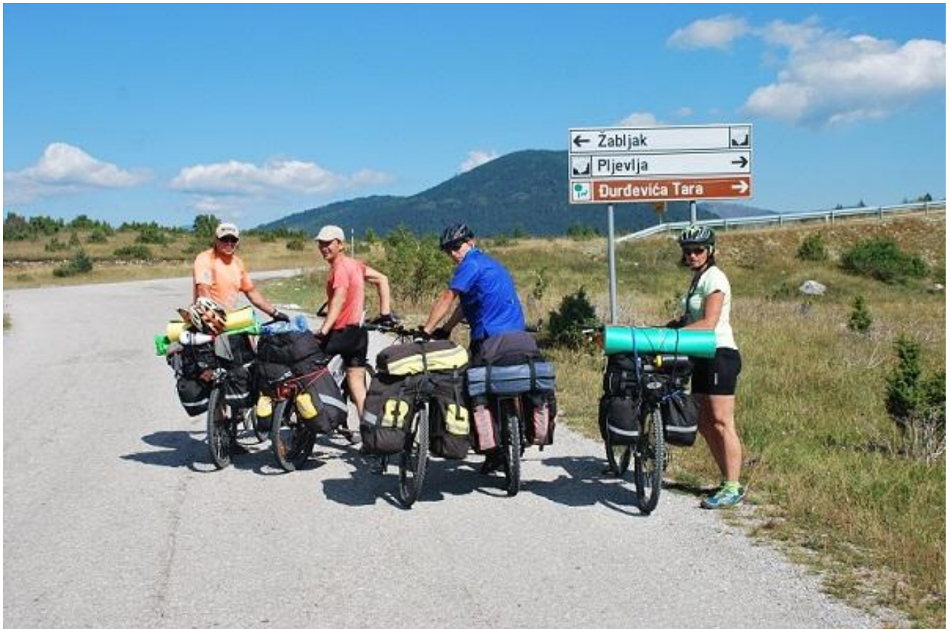
Фото 65. Указатель выезда на трассу и перевал Jabljak (1342м).