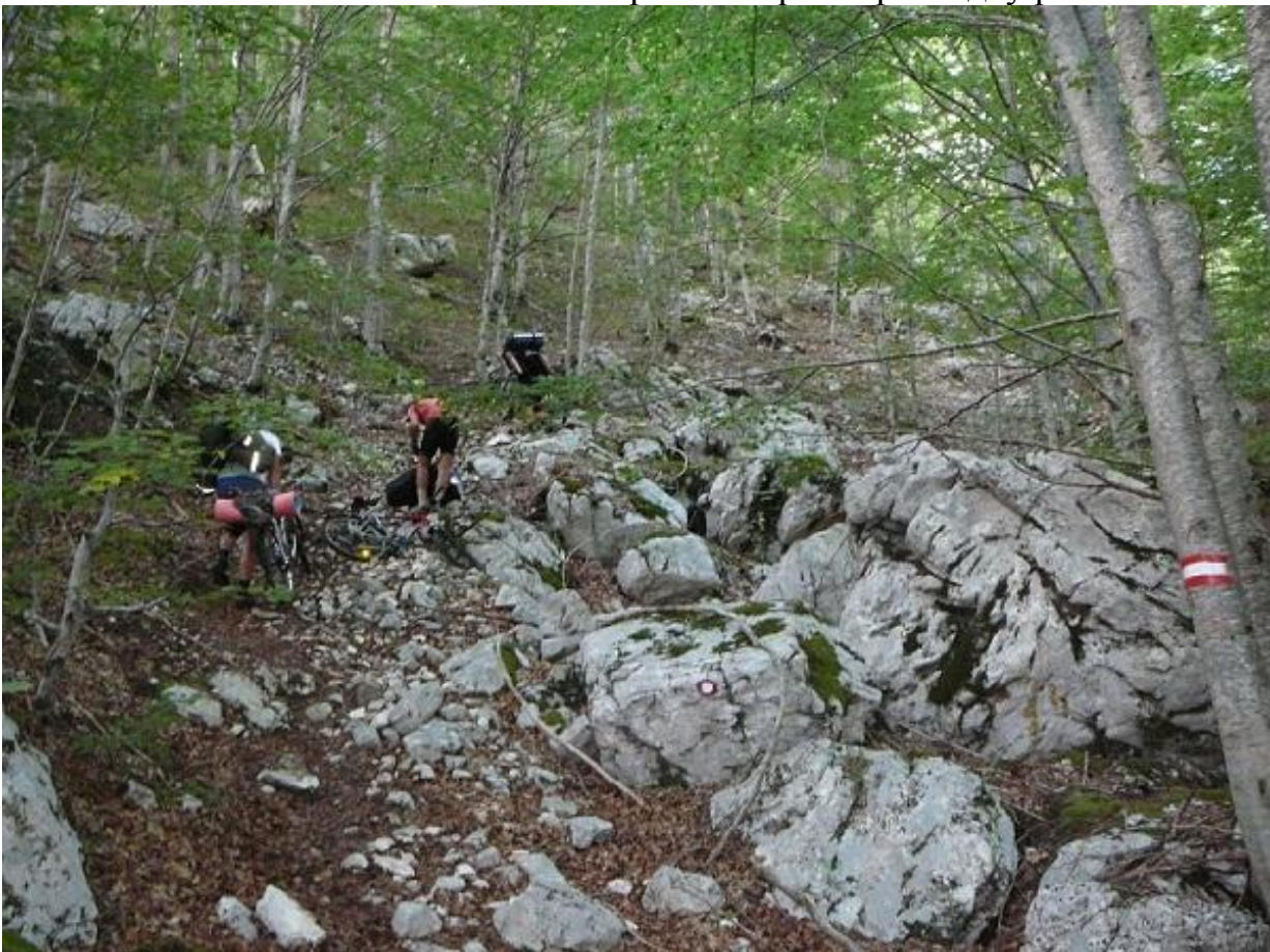
Фото 32. Начало трудного участка тропы, перемещаем велобаулы за плечи.