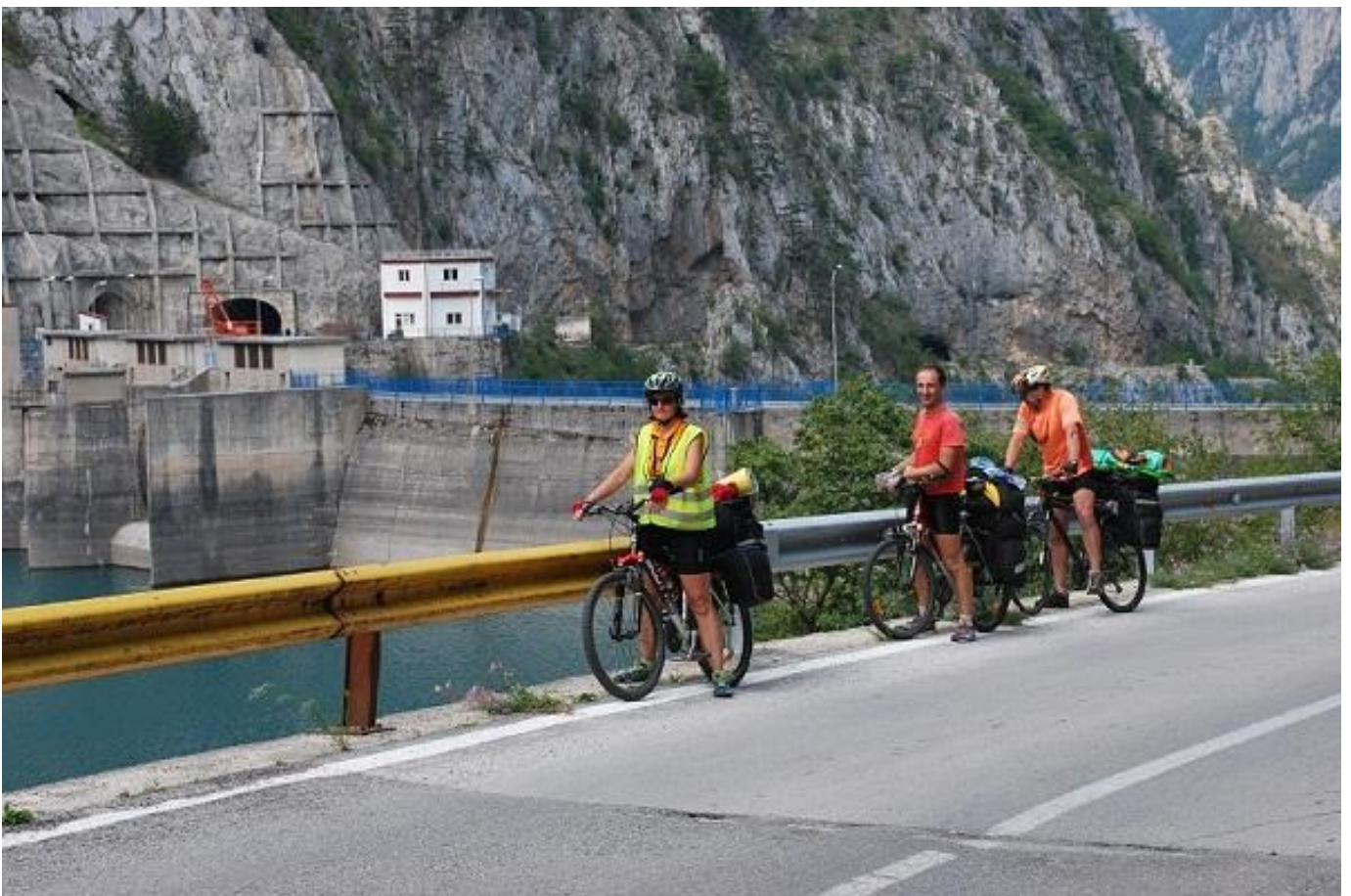
Фото 12. Платина и начало Пивского водохранилища.