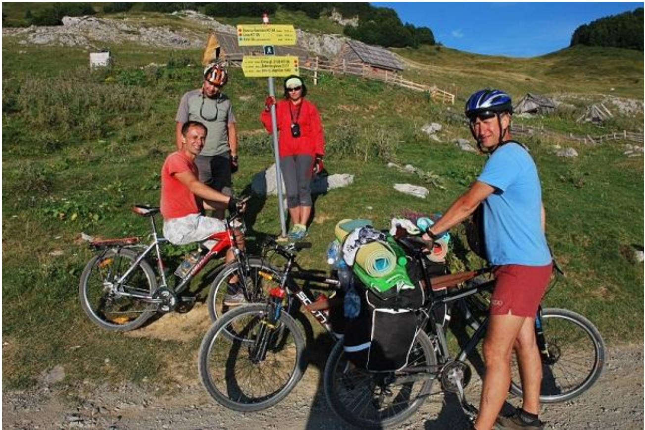
Фото 77. Катун Vranjak. По дороге 100 м горный источник.