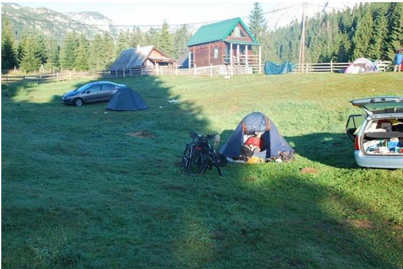
Фото 59. Кемпинг в Ivan Do. Полудневка.