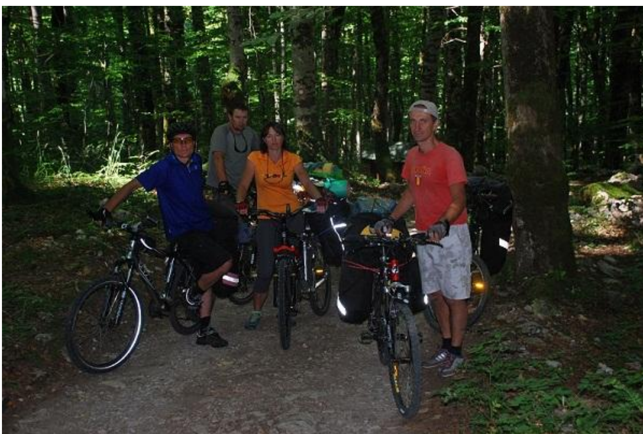
Фото 70. Начало лесной грунтовой дороги на перевал Biogradska гора.