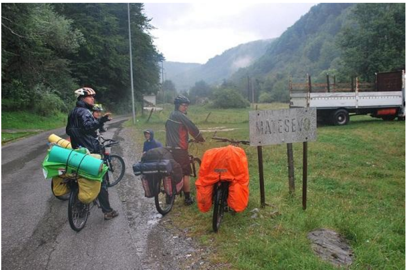
Фото 84. Matesevo.