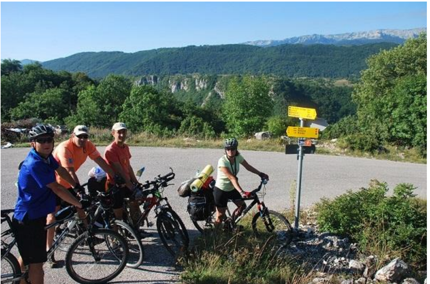
Фото 22. Развилка дорог. По указателю на право Вејие (1065м).