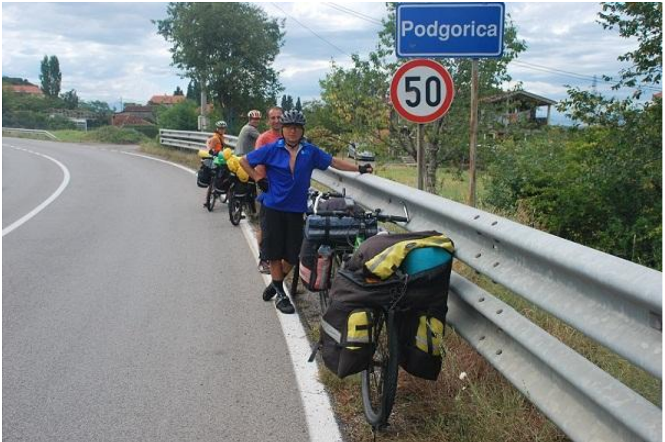
Фото 87. Podgorica.